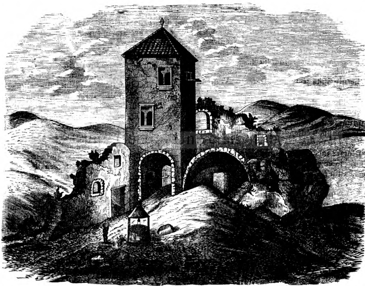
Cetatea de la Hododu in Selagiu (Vedi pagin'a 381.)

— Me iérta, frate, — se escúsá protopopulu — dar daca-e vorb'a de bataia, apoi eu nu-ti potu fi intru ajutoriu. Mi-spelu manile, dar in asié ce-va nu me amestecu. Eu am muiere si prunci a casa.