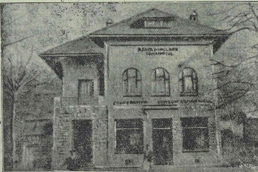
Szövetkezeti-ház a Prahova völgyében Comarnic községben.

A petróleum beszerzésére különösen nagy figyelmet fordít az előrelátó háziasszony. Nagyon sok helyen vándor szekeresek járnak a falvakat s nagyobb mennyiségben olcsóbban kínálják a petróleumot, amiről nem is tudhatja a vevő, hogy volt-e finomítva. Az ismeretlen fu-