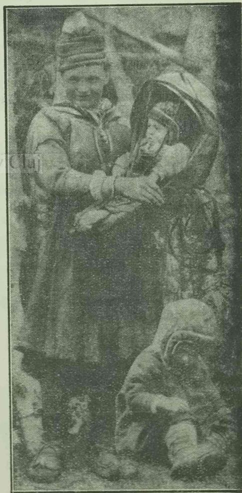
Az örök-hó hazájából.

A múlt hét folyamán hatalmas földrengés rázta meg a szigetország partvidékét 500 km.-es hosszúságban. Közel 12,000 ház omlott össze. A halottak számát még nem lehetett véglegesen megállapítani, mivel a romok alól ujjab és ujjab áldozatok kerülnek elő. Eddig a sebesülteken kívül, háromezerre becsülik a halottak számát.