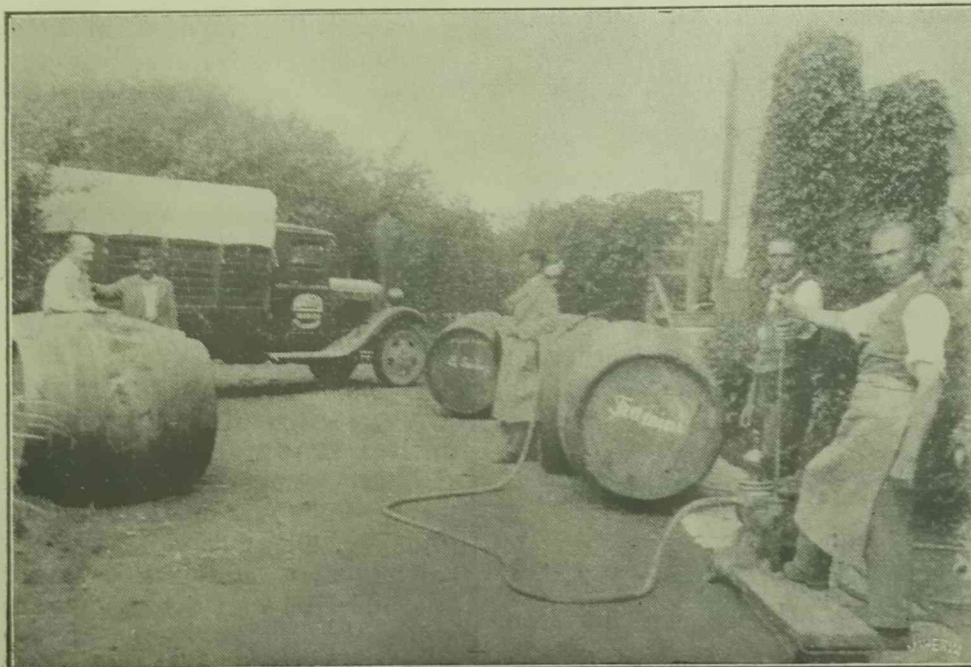
Borszállítás a sepsiszentgyörgyi „Hangya” Áruraktár pincéjéből.

Ne mulassza el megtekinteni a „Hangya” kiállítási termét. I. emelet Internátus.