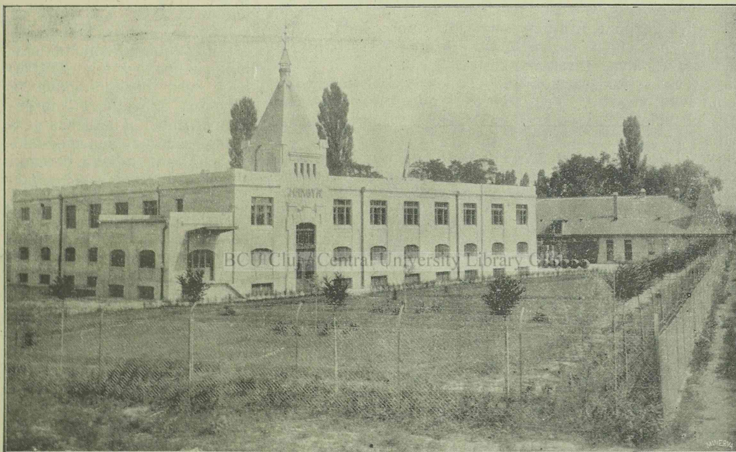
„Hangya” Szövetkezetek Központjának székháza Nagyenyeden.

Szerkesztőség és kiadóhivatal : NAGYENYED. Évi előfizetése 120 Lei.