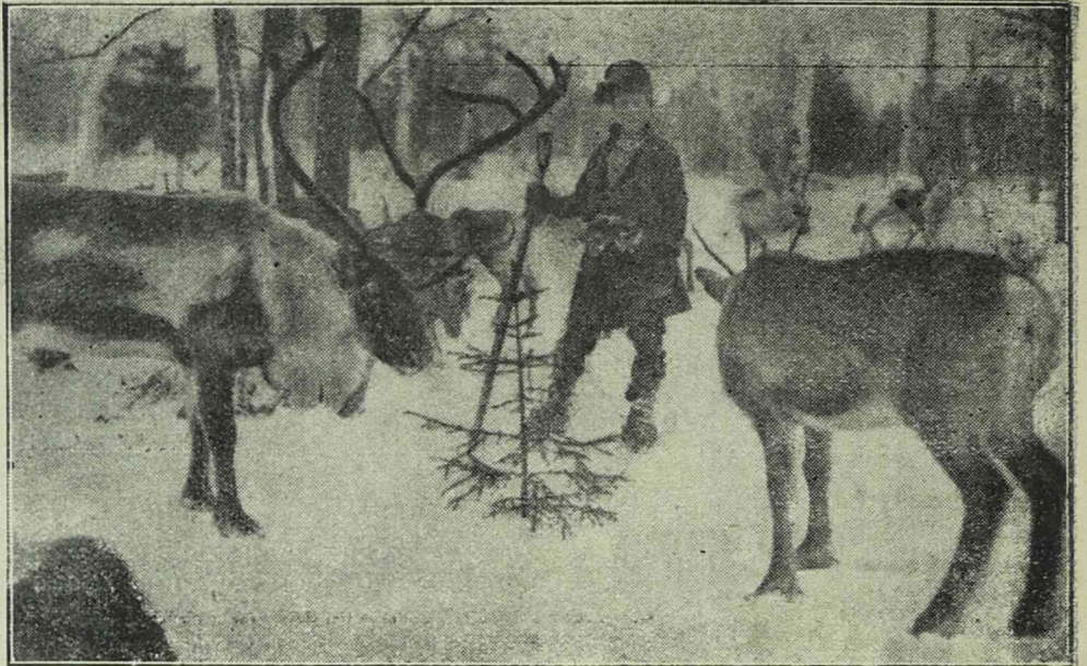
Szelidített iramszarvas-csorda Kawada északi részén.

Építenek a németek, amelynek hossza 248 méter, míg átmérője 41 méter. A léghajó óránkénti sebessége 130—150 kilométer lesz.