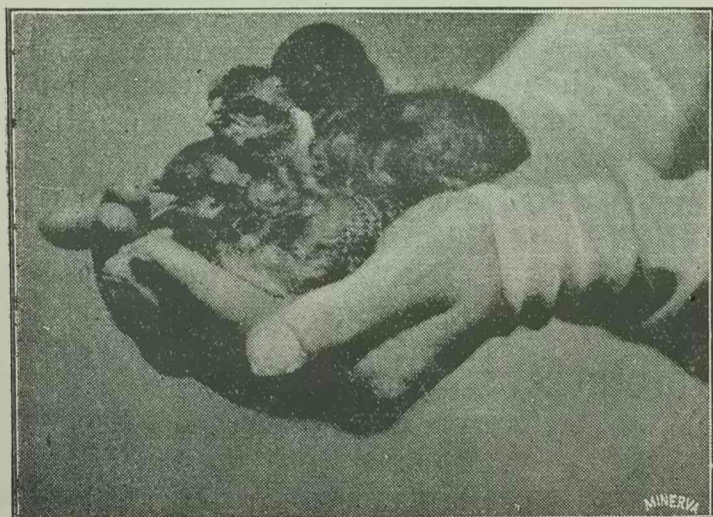
A tavasz hírnökei.