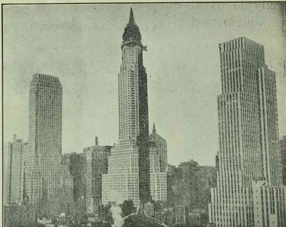
Részlet New-Yorkból. Középen a 67 emeletes 330 m. magas Chrysler felhőkarcoló.