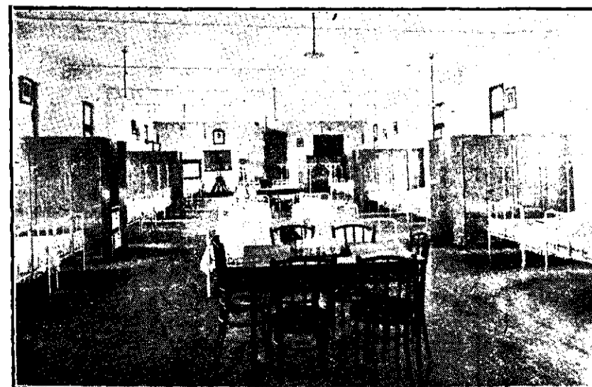
Un dormitor model al internatului.