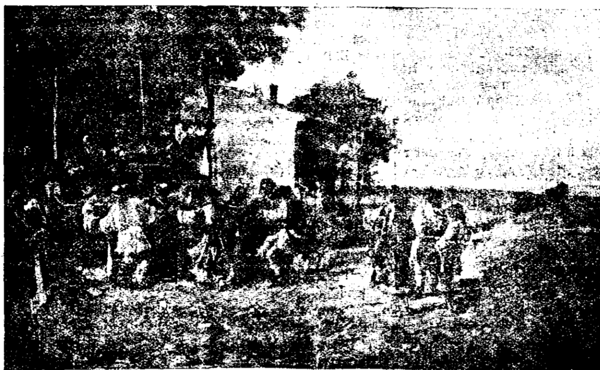
Petreceerile noastre dela sate. — Hora țărănească

în scrisoarea către adunarea studenților, în Slatina, la începutul lui August 1929.