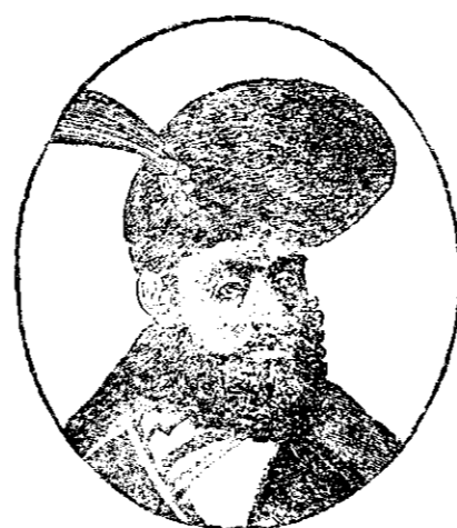
Mihai Viteazul 1593—1601