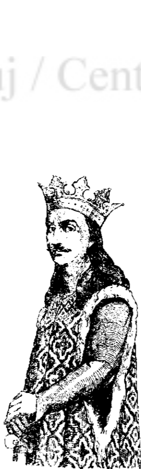
Ștefan cel Mare 1457—1504