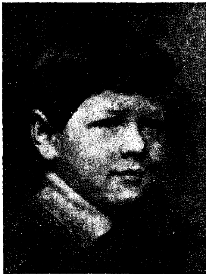
M. S. Regele Mihai I și A. S. R. Principesa Mamă Elena.

Prin muncă și înfrățire să întărim unirea tuturor Românilor