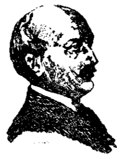
Vasile Alecsandri Marele poet care a cîntat mult vitejia ostașului român.