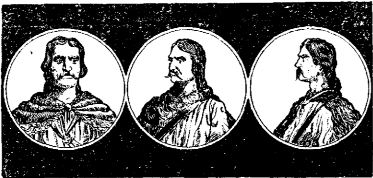
Horia, Cloșca și Crișan Martirii neamului românesc din anul 1784.