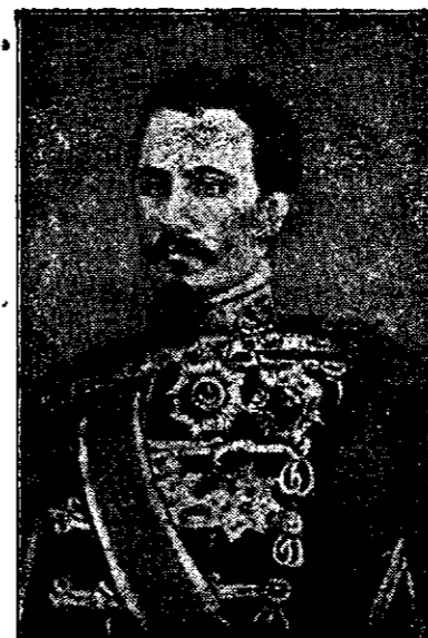
Al. Ioan Cuza 1859—1866