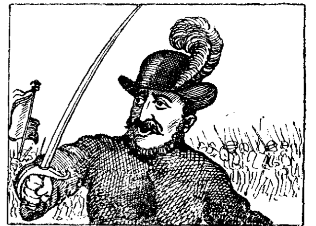
Avram Iancu din țara Moșilor zis «Regele Munților».

În drept, asta se tâlmăcește zicându-se aceste lucruri mișcătoare sau nemiscătoare, daruite de înfiător să se găsească în natură în moștenirea înfiatului, adică să fie identice aceleași, în specie, să nu fie prefăcute în bani, nici schimbate cu alte lucruri.