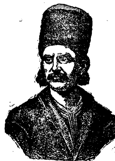
Tudor Vladimirescu (1821)

Rugăm pe D-nii Colaboratori, a ne trimite articole mai SCURTE, spre a fi publicate mai