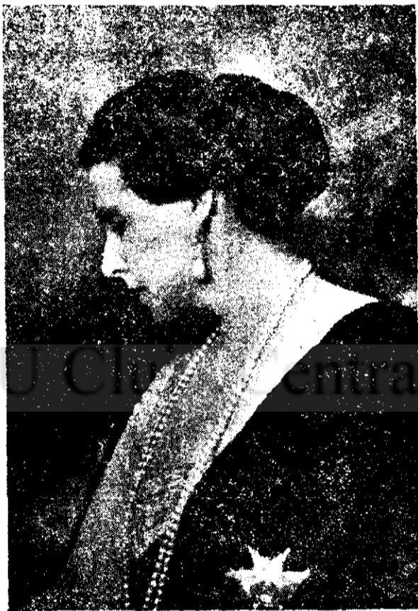
Regele Ferdinand I și M. S. Regina Maria (Unirea tuturor Românilor).