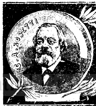
C. A. Rosetti fost mare om de stat în 1848