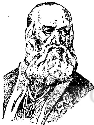
Andrei Baron de Șaguna Primum Mitropolit greco-oriental la Sibiu