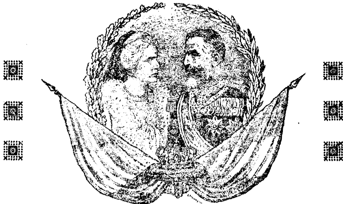
Regele Carol I și Regina Elisabeta (Independența și înființarea Regatului României).