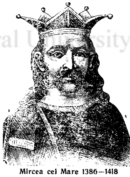
Mircea cel Mare 1386—1418