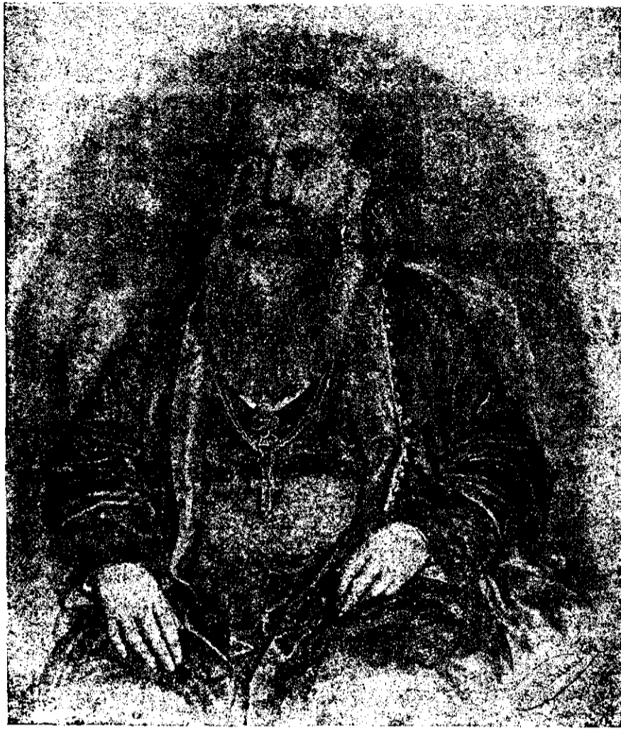
Mitropolitul Andrei Baron de Șaguna