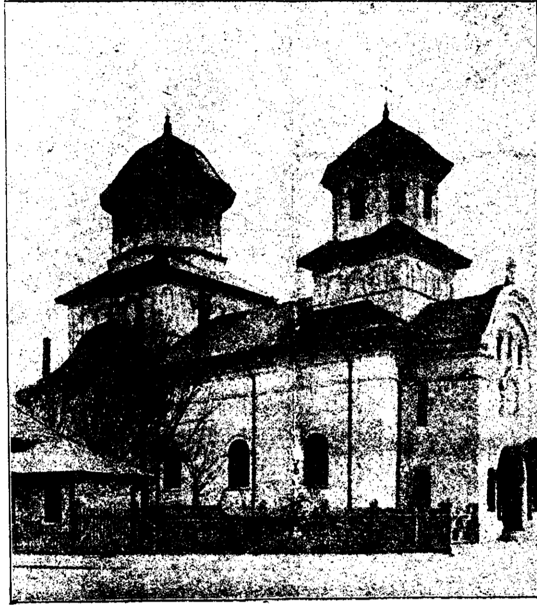
Biserica «Cărămidarii de jos» din București.

Libertatea este un dar al omului dela Dumnezeu și se află cuprins în cuvintele: „Creșteți și vă înmulțiți și umpleți pămîntul și-l stăpîniți pre el.” (Facerea I,28). A stăpîni în afară înseamnă tocmai a avea puterea dinăuntru, și pe aceasta o are omul dela Dumnezeu, fiindcă l-a făcut ființă cu înțelegere, cu voință și simțire, puteri fără care nu este adevărată libertate.