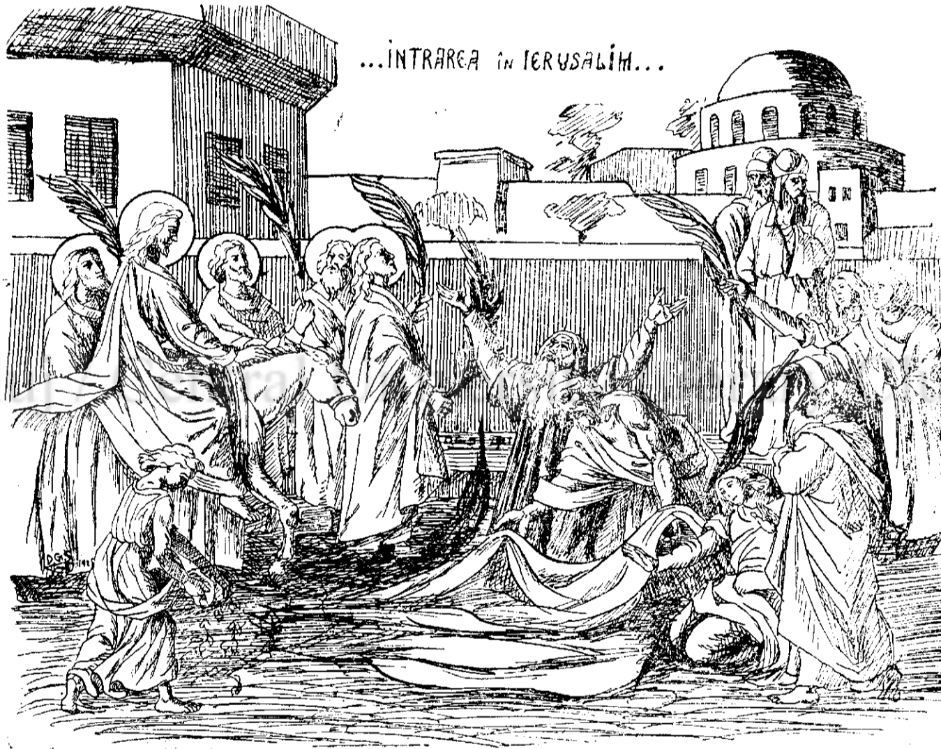
...INTRAREA IN IERUSALIM...