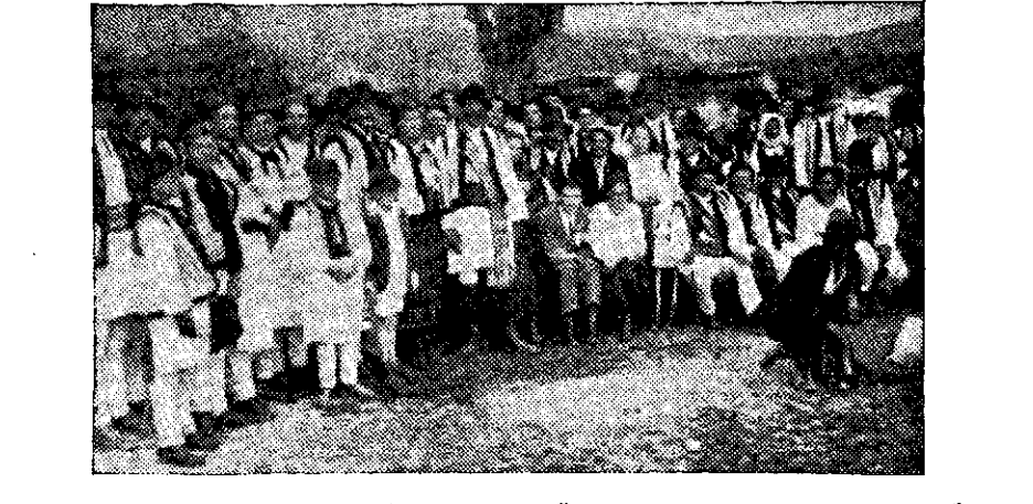
ECHIPA DE PROPAGANDĂ A SOCIETĂȚII „MOLDOVA ÎNTREGITĂ” CU SOCIETATEA „ARCAȘII” DIN SATUL POPĂRTA, JUDEȚUL CÂMPULUNG, BUCOVINA

Bucovinei și Moldovei, în lunile Iulie și August.