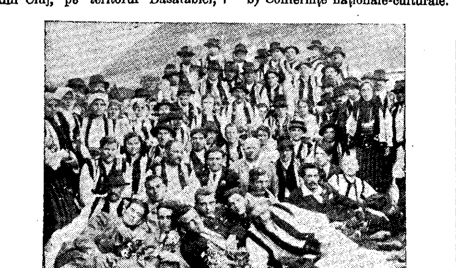
ECHIPA DE PROPAGANDĂ A SOCIETĂȚII „MOLDOVA ÎNTREGITĂ” ÎMPREUNĂ CU ARCAȘII DIN SATUL POPĂRTA, JUDEȚUL CÂMPULUNG, BUCOVINA

Se știe despre turneul de combatere a bolilor sociale și propagandă națională făcut de societatea studentească „Moldova întregită” din Cluj, pe teritoriul Basarabiei,