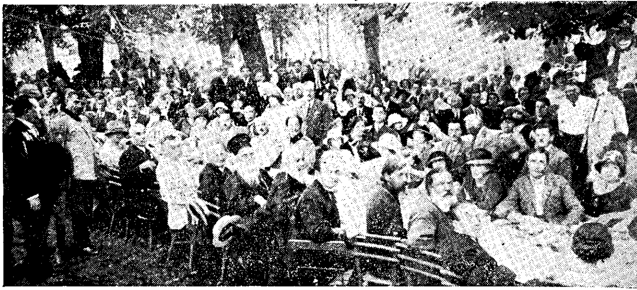
MASA ÎN GRĂDINA DIN CLUJ LA CARE AU LUAT PARTE 560 DE MOLDOVENI EXCURSIONIȘTI.