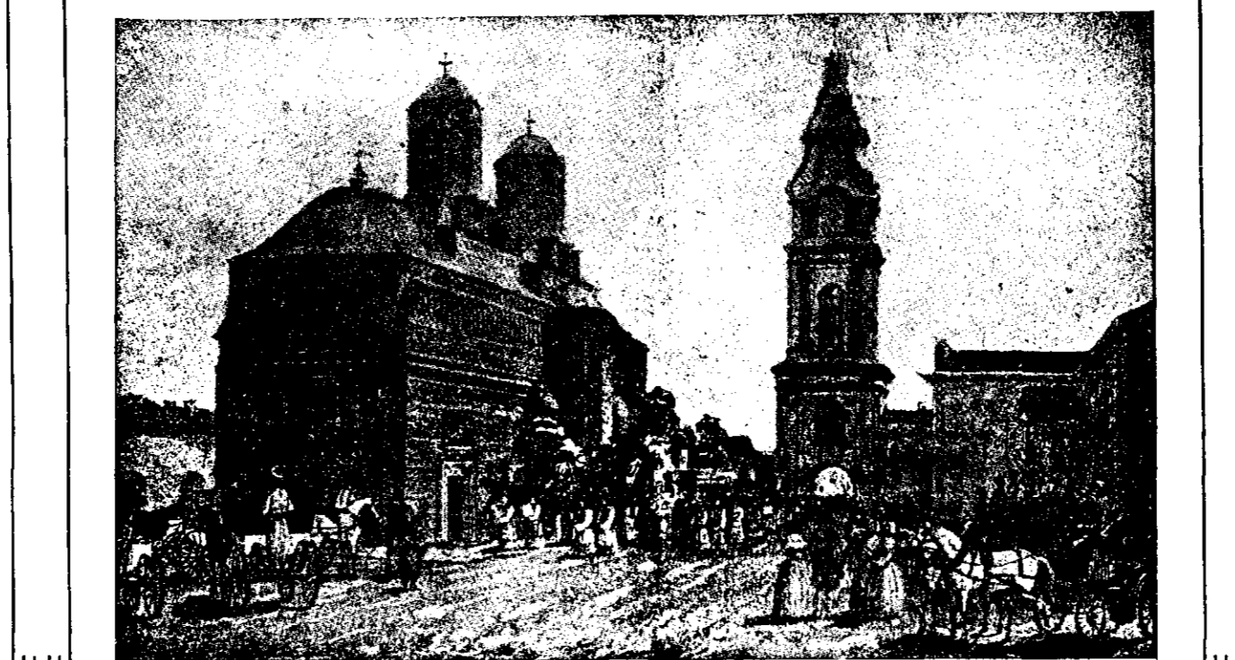
Iași vechi: Mănăstirea Trei-Erarhi, cum era la 1845.