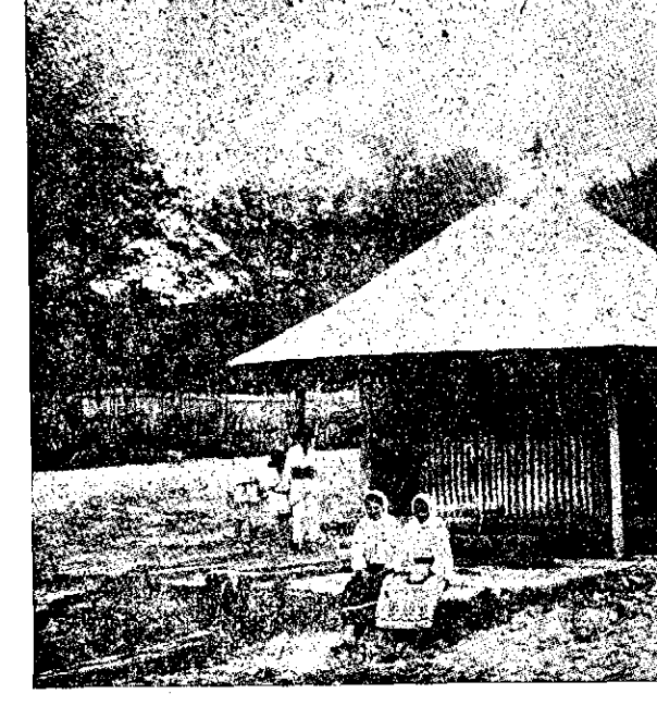
VEDEREA DE AZI A ȘTUBURULUI LUI MIRCEA AL I-LEA CIOBANUL

Toată această moșie, avea peste 1540 de pogone. La anul 1854, ea se împarte în două părți egale: jumătate, adică 770 pogone și 838 st. p., despre miază-zii, trece în posesiunea nevrăstnicului Bucșenescu și ia numele de moșia Bucșenescu și jumătate adică 770 pogone și 838 st. p., spre miază noapte, dintr-în posesiunea D-rei Izvoarea Stanca Di-