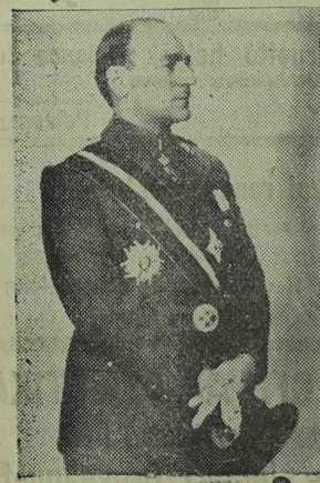
ARMAND CALINESCU miniszterelnök

Az ország egész lakossága tisztelő kegyelettel hajt fejet az elhunyt egyházi és országvezér emléke előtt.