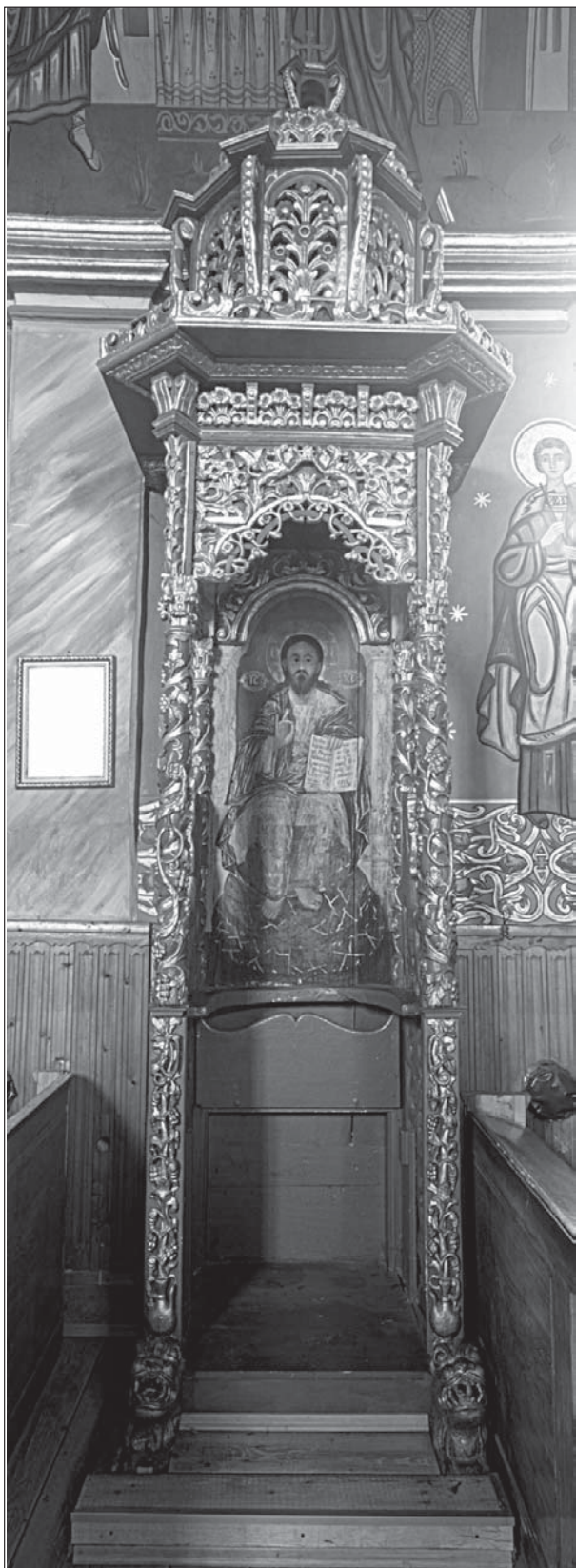
FIG. 6. Trono vescovile (1768)