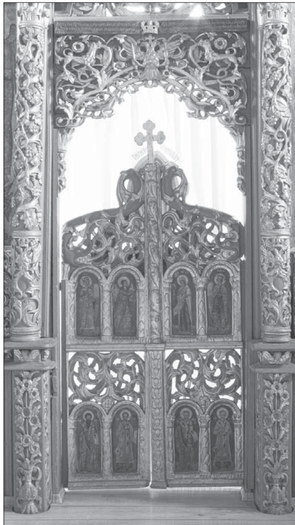
FIG. 4. Porte reali: