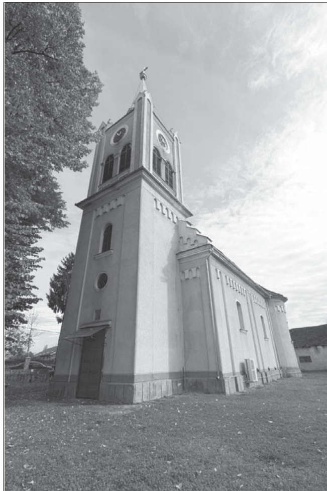
FIG. 1. Chiesa ortodossa "Santi Arcangeli Michele e Gabriele" (1790)

iconostasis, paintings, church, Vadu Crisului, style, art