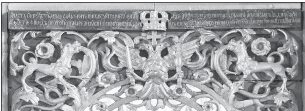
FIG. 5. Iscrizione (dove vi è precisato il nome del vescovo greco-cattolico Meletie Kovacs e l'anno della realizzazione dell'iconostasi: 1768)