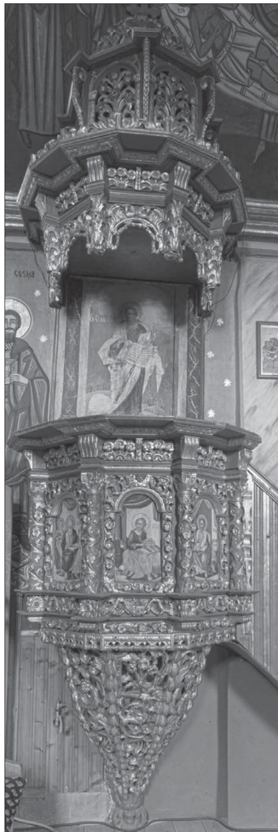
FIG. 7 – PULPITO (1768)