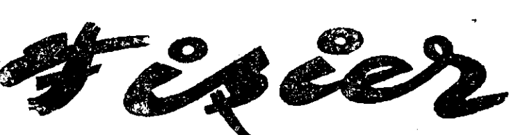
(Urmare din pag. 1-a)

(Urmare din pagina 1-a) Înăuntrul „Cetății literare”, chiamă la uluci, cu orice „amuseur”, toată mahalaua literară, să vadă ce n'a mai văzut, ceva „nemăpomenit”: