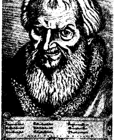
Hans Sachs sugar: personalități dotate cu mari însușiri artistice. Cazul lui Hans Sachs, poetul cismar, născut la 1494, mort în 1576, e ce-

Simțul artistic e foarte dezvoltat la Germanii și, ceea ce e atât de laudabil, ei n'a constituit niciodată apanajul unei singure clase sociale. În Germania veche, ca și în Germania de azi, nu e ceva rar să vezi și între mește-