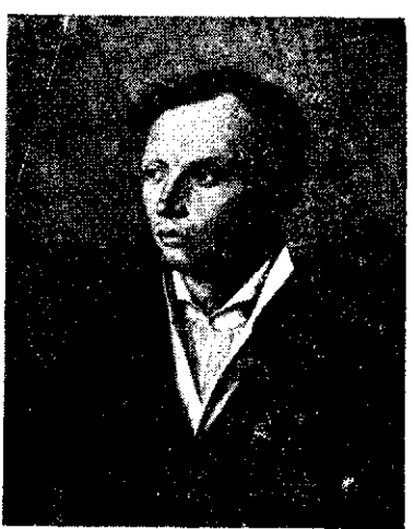
Uhland sau Eichendorff.