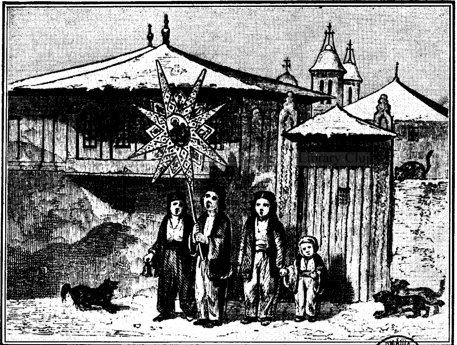
Cu steaua de CHARLES DOUSSAULT