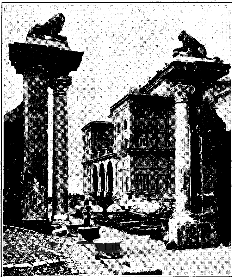
Vila Falconieri, lângă Roma pe care primul ministru al Italiei Mussolini a oferit-o în dar lui Gabriel d'Annunzio marele poet și patriot italian.

Ajunse în sfârșit, la Râsăruci. Două drumuri se încrucișeau în acest loc: unul dinspre miază-noapte, care ducea în sat și la curtea boerească; și altul dinspre apus, care străbătea pădurea în lung și se sfârșea în târgul Hulubeștilor.