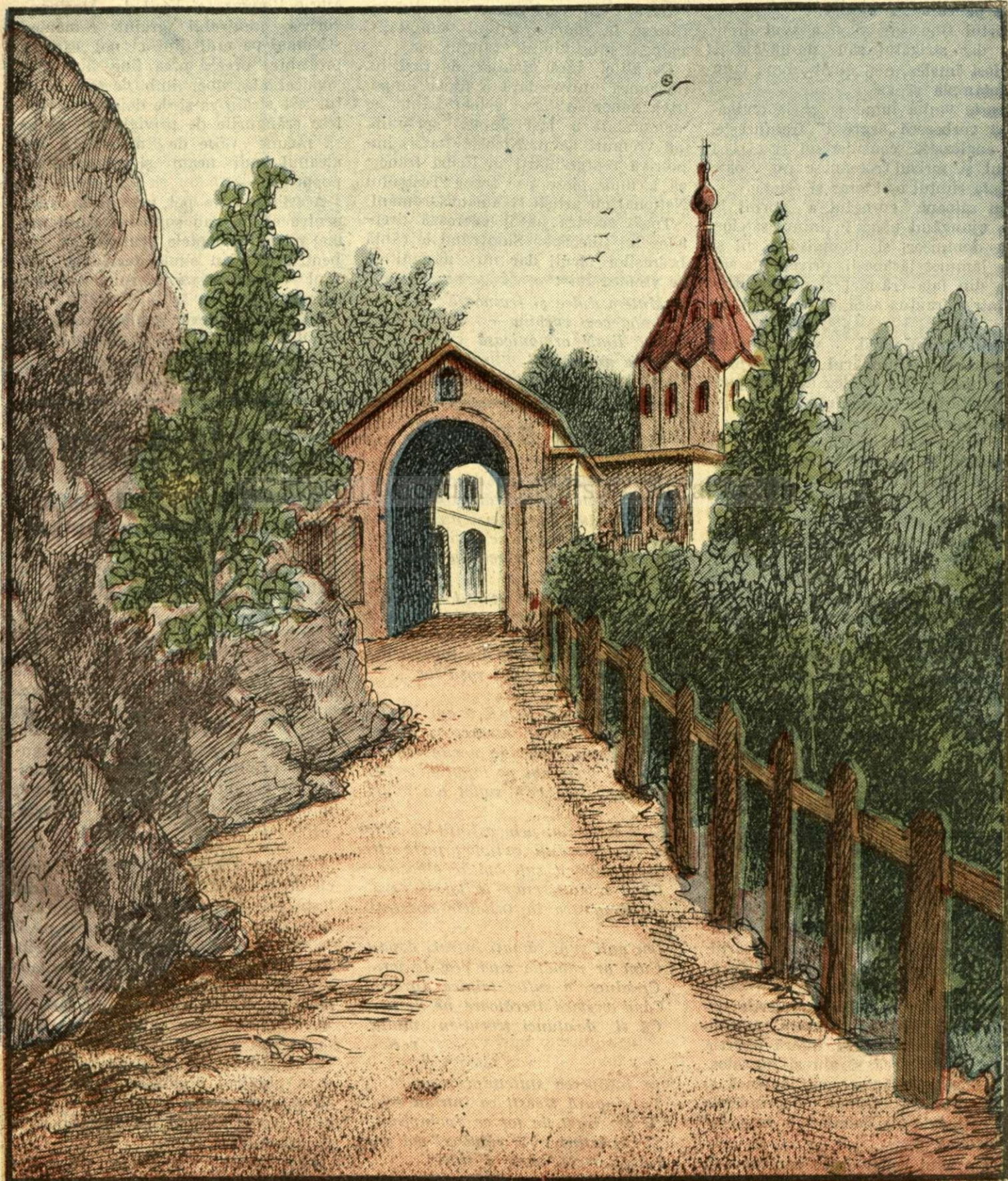
Mănăstirea Ladova (Basarabia). — (Vezi explicația în pag. 4).