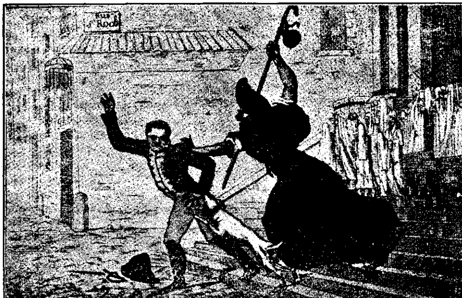
REVANȘA.—Tab'ou de Vaidier.