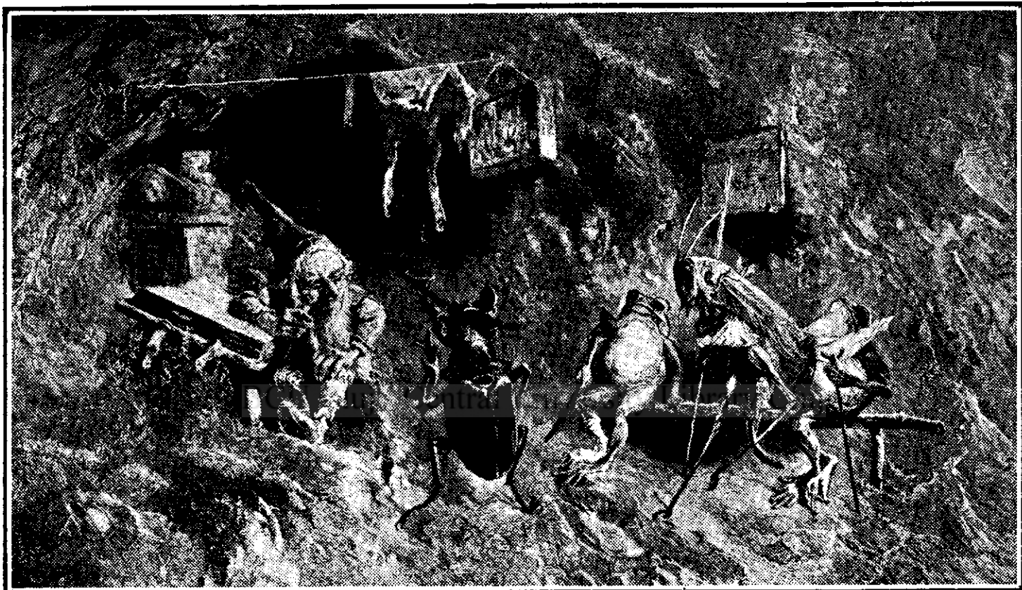
„Medicul Pădurii în ora de consultații” de Heinrich Schlitt

zentări mai superioare de cât le bănuim și dacă nu le manifestă extern, cel puțin le trăiesc în interiorul lor.