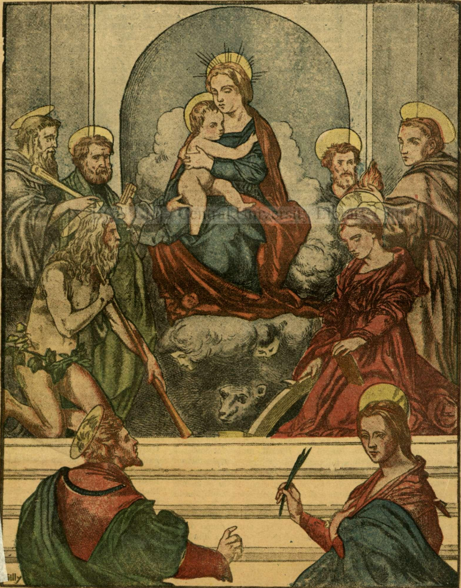
Andrea del Sarto „MAICĂ DOMNULUI CU ISUS