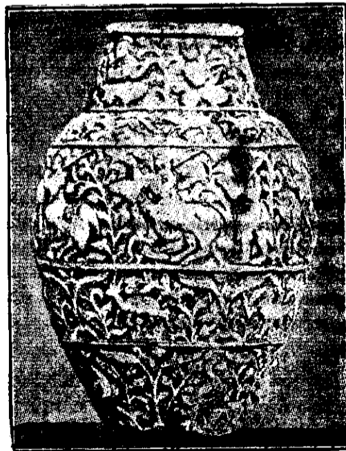
Arta musulmană. Vas glazurat persan, veacul al XV-lea.

mai prin snobism și modă dar și prin tendința aceea instinctivă de a se găsi ritmul acela, formele acele constructive, care au fost la baza culturii și artei orientului. Arta musulmană din acest punct de vedere este foarte interesantă, căci ea este legată de anumite legi religioase care au permis