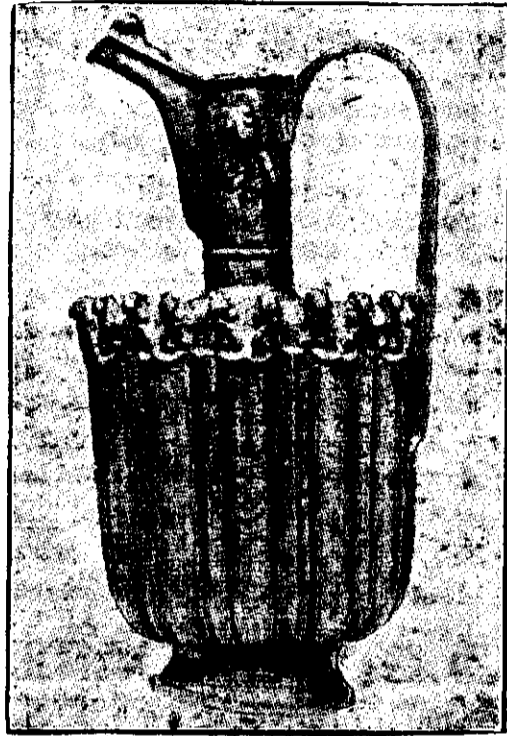
Arta musulmană. Vas de argint persan, veacul al XV-lea

Interesul pe care-l prezintă Orientul din punctul de vedere politic deșteaptă curiozitatea lumii intelectuale din Apus și asupra culturii și artei popoarelor din Orient. Curiositatea aceasta nu trebuie explicată nu-