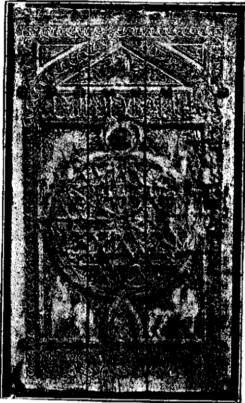
Poarta de intrare in lemn

artei musulmane cred că arta în general, arta europeană, n'ar avea de cât să câștige dacă ar împrumuta principiile fundamentale ale ornamentației și decorației orientale, căci încă eri, spun ei, nu se întâlnește atâta armonie între compoziția ornamentu-