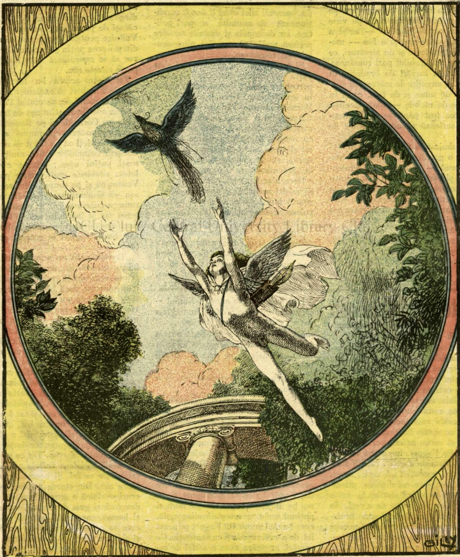
F. M. Roganeau. Eros urmărind pasărea albastră.