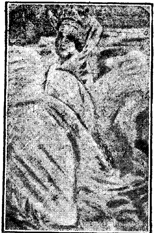
Wrubel; Impărăteasa Lebedă

Pictorul rus arată ceea ce au făcut o întreagă pleiadă de pictori ruși cari s'au consacrat ilustrației poveștilor istorice și populare și cum au reușit nu numai să dea desenului lor