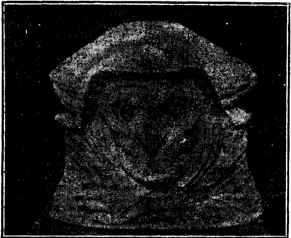
Ober: „Mama Pădurilor”

În povestea populară, în basmul povestit de veacuri în veacuri, din generație în generație este tot sufletul unui popor. În poveștile populare se