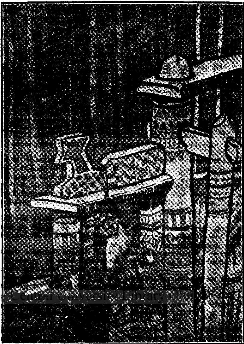
E. Pottenova. „Cum pisica a înșelat vulpea” (Vezi nuvele: „Ilustrații pentru copii”).