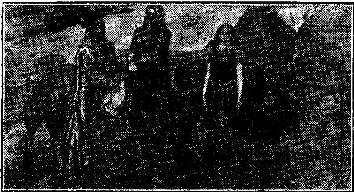
Victor Vaznetov: Trei împărătese ale împărăției de sub pământ.

rile rusești întrebuintau în desemnul lor aceleași linii a artei Apusului și nu reușeau să dea chipul ideal al acestor povestiri, care nu putea fi de cât cel național, povestirile istorice ca și bazmele, am spus, sunt creația sufletului unui popor, unei națiuni.