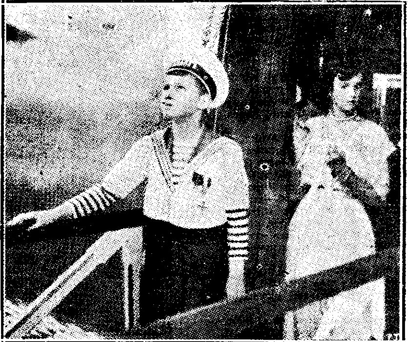
Țarviciul și marea ducesă Tatiana

la prins de pește, ca să simtă ce rău e să nu fii primar și ora cu pricepare.