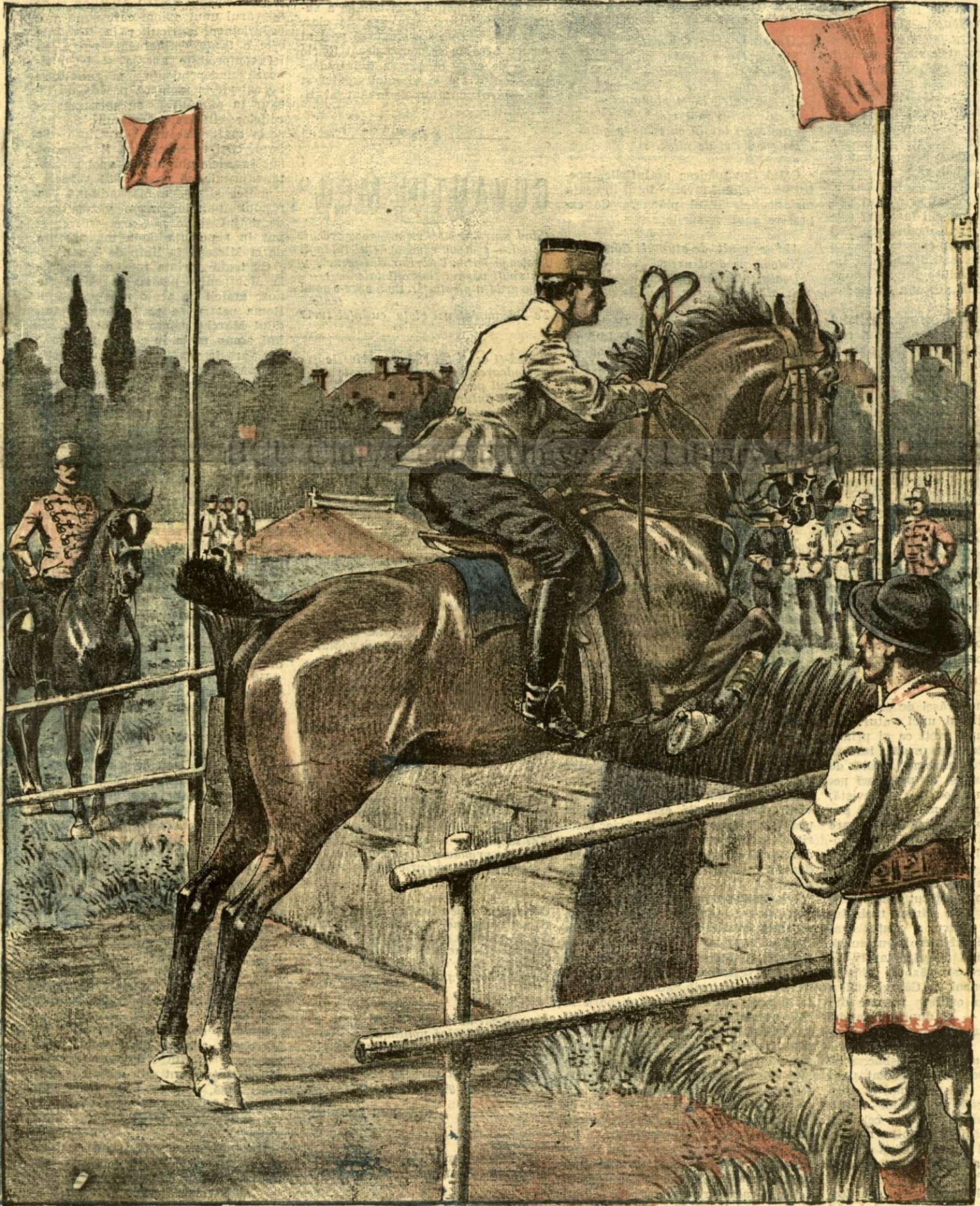
Un concurs hipic

ANUNCIURI Linia pe pagina 7 și 8 - BANI 20 -