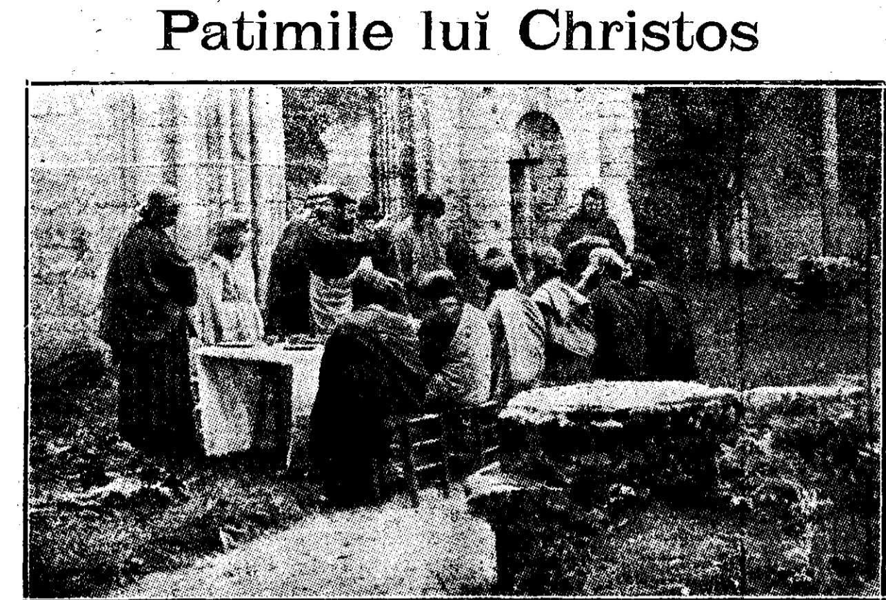
În ruinele abației din Jumièges, de lângă Rouen (Franța), s'a reprezentat „Adevăratul mister al Pașunii”, piesă religioasă compusă de Arnoul Grehan, doctul canonic al mănăstirii Saint-Julien din Mans, în 1452. Este scena „Cinei cea de taină”

1) Din volumul care va apărea în curând: „Cântul Valurilor”.