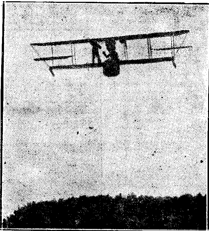
Hidravienul cu stabilizator giroscopit văzut, în spațiu, c'un pasager stand în picioare pe una din aripele lui.

Mi-aduc aminte că, acu vreo zece ani, stăteam în strada Păpu cu apa rece. Ei bine, domnule, s'a găsit proprietarul — un fost bărbier — să-mi insulte nevasta... Am găsit-o în lacrimi... S'a supărat dumnealui, fiindcă bucătăreasa noastră a vărât un lighean cu zoaie în curte... Eu