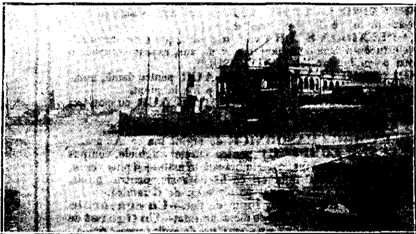
Palatul Companiei Canalului

sub umbra cărora stau înghesuți sute de arabi în halaturi albastre, verzi, galbene și alte culori, ospătându-se. Pe drum, vânzătorii de limonadă și zaharicale înconjurați de cete de copii îmbrăcați ca și părinții lor; fetițe negre ca tăciunele, împodobite cu flori ca paparudele noastre; femei voalate, desculțe, cu brățări la picioare; scamatori producându-se pe maidan în mijlocul unor cercuri de curioși; cântăreții publici cântând din gură și din cobză, în fine, o animație