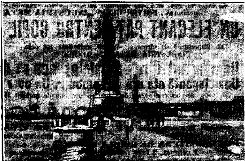
Monumentul lui Leassep

Portul acesta atât de important azi, nu datează decât din anul 1853 când a început să se sape canalul de Suez. Primii locuitori au fost funcționarii cana-