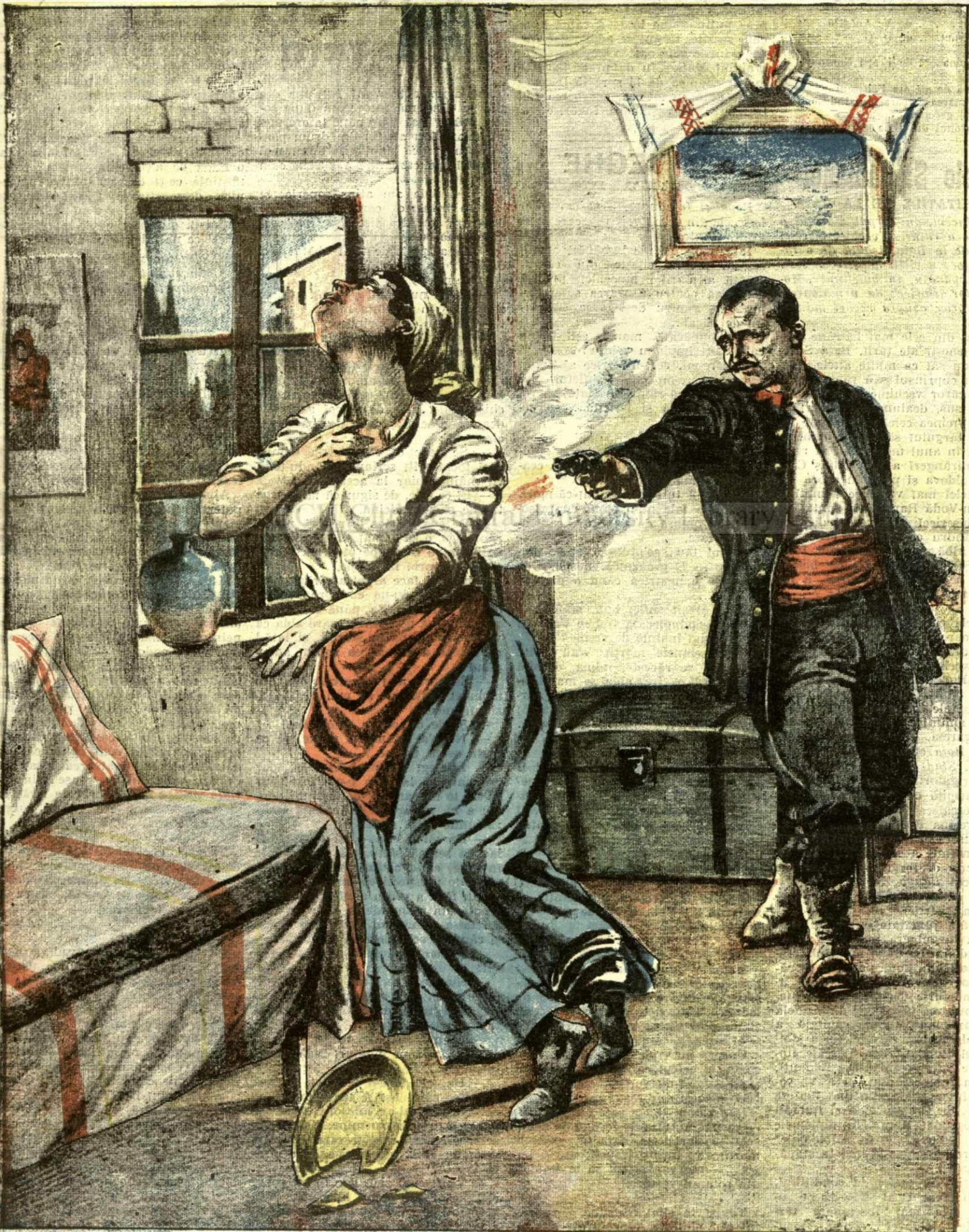
INFIORATOAREA DRAMA DIN FALTICENI. — (Vezi explicația).