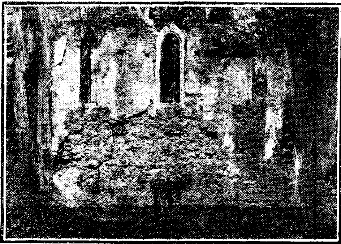
O VEDERE DIN ALTAR A RUINELOR BISERICII CATOLICE DIN BAI

— Generalul îi dăruiește viața, dacă primești să-ți fii bărbat, îi zise el cu vocea sopțită.