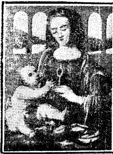
Fecioara și pruncul de Leonardo da Vinci

Când calci în spălătură (apa cu care ai spălat cămașile) nu-i bine.