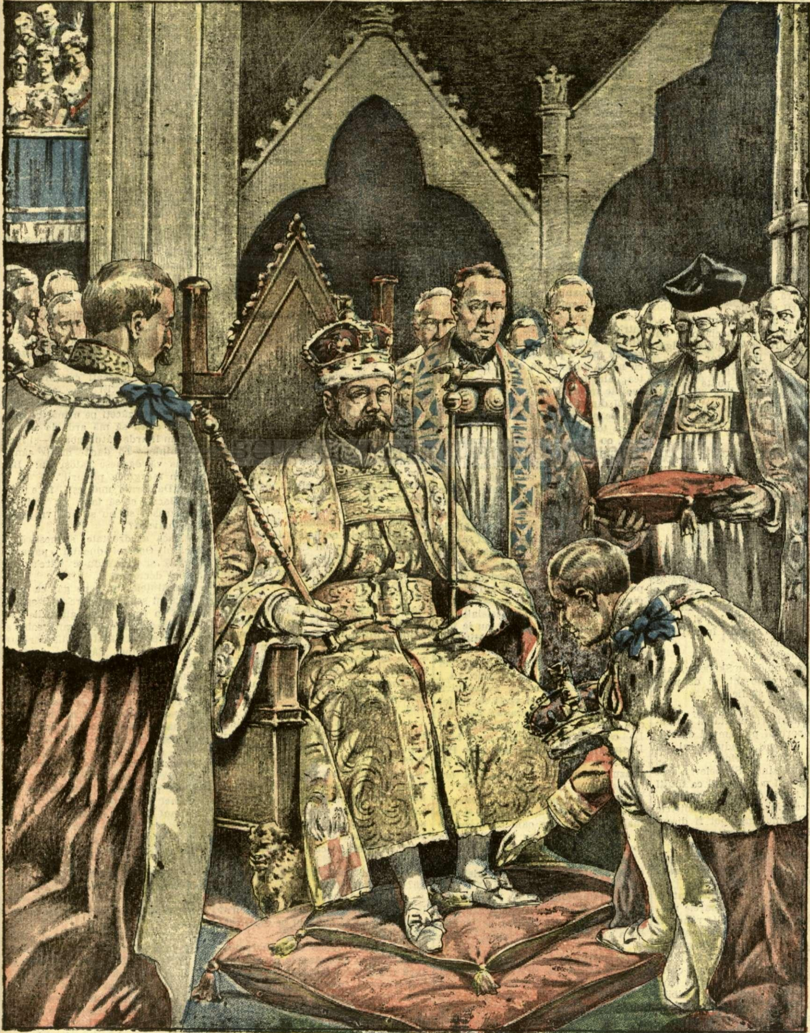
INCORONAREA REGELUI GEORGE AL ANGLIEI. -- (Vezi explicația).