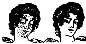
Înainte și După întrebuințarea Cremei și Pudrei «Flora».

se obține prin întrebuințarea cremei și pudrei FLORA preparate de Al. Iteanu farmacist, furnisor al Curții Regale. Pudra «FLORA» fără bismut mărește efectele uimitoare ale cremei «FLORA». Crema lei 1,50. Pudra «Flora» lei 2. Săpun Flora lei 1,25. Pomadă de păr «Flora» neîntrecută pentru îngrijirea rațională și igienică a părului, lei 2,50. Capilogen «Flora» (apă de păr) sticla mare lei 3,25, mică 2,50. Pasta de dinți «Bucol» lei 1. Apa de gură «Bucol» lei 1.50. Lapte de crin «Flora» pentru înfrumusețarea tenului lei 2. Săpun de Lapte de crin «Flora» lei 1,25. La nemulțumire se restituie imediat costul.