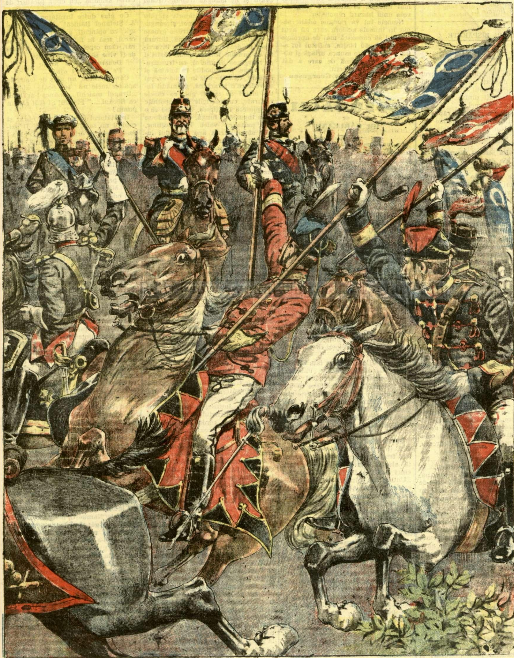
TRAIASCA REGELE!. — (Vezi explicația).