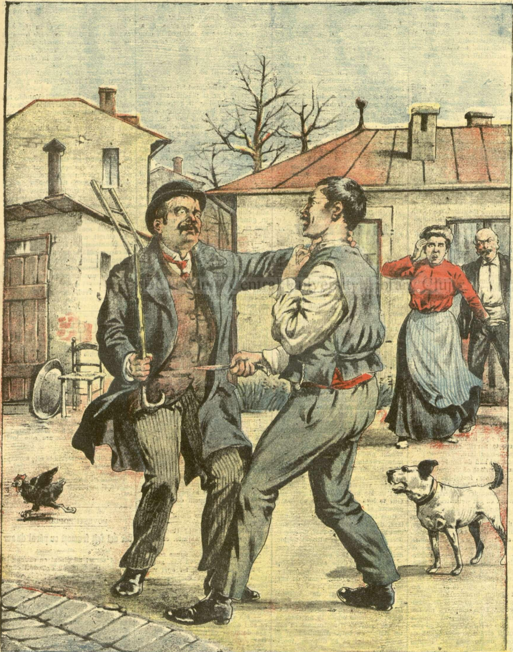
UN FRATRICID PENTRU O AVERE. — (Vezi explicația).