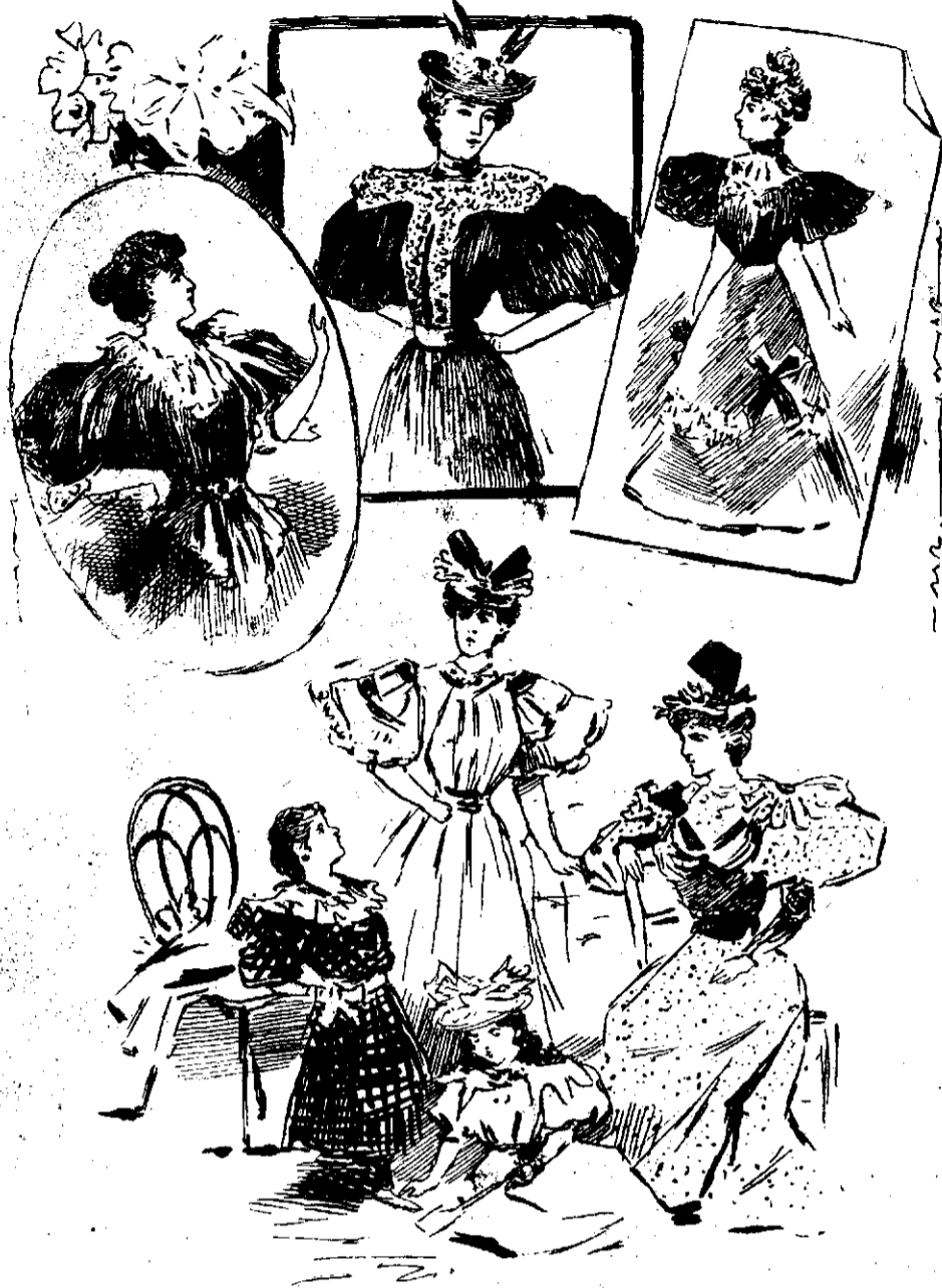
MODA. — (Vezi explicația).