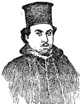
Creangă ca Diacon

Au intrat voioși într'o crâsmă, s'au cinstit după datină cu câte o garafă de vin; iar apoi s'au dus