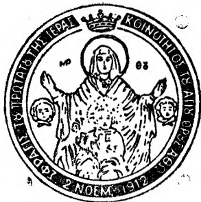
Sigiliul Republicii Muntelui Athos

Dacă examinăm sistemul constituțional al republicii Muntelui Athos, vedem că el se bazează pe principiul confuziunii puterilor publice. În loc ca puterea executivă, legislativă și juridică se fie separate, ele se confundă și se exercită în același timp de către aceleași instituțiuni constituționale. Este de altfel sistemul caracteristic al regimurilor comuniste, cari neagă cu desăvârșire principiul separațiunii puterilor.