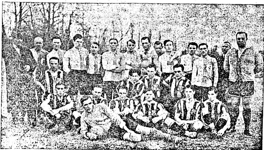
Târgu-Mures — Cluj 2:0 (1:0)

mondotta ki ebben a dologban az utolsó szót és talán sikerülni fog álláspontjának megváltoztatására birni. A husvéti program felborulása annál sajnálatosabb lenne, mert a Simmeringer SV szerzett volna ugyanakkor Clujon játszani és a pesti attrakciókra való tekintettel a bécsi csapatot nem költötték le, ugyhogy nagyon szerény és sovány husvéti sportra van kilátás.