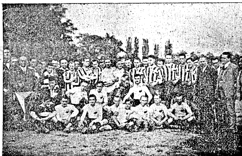
Cseh—Román válogatott 6:0. Csikos jngben a csehek.