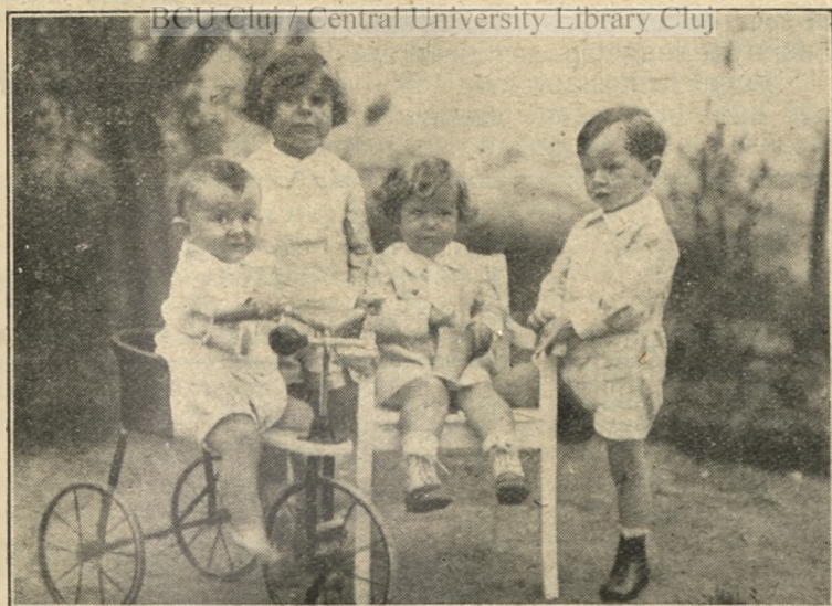
Délután 4 óra — \frac{1}{3} mp. blende 9.

Legutóbbi cikkemben a téma megválasztásával foglalkoztam, amelynek folytatásaképpen még néhány hálás és hatásos tájkép témát fogok körülírni, mondjuk helybeli ada-