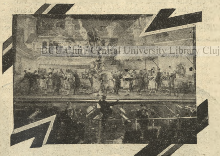
Színes jelenet a „Primadonnák lovagjai“ c. énekes és hangos Metro-filmből

Mint ismeretes, Hollywoodban a nagy távolságok miatt, majdnem minden sztár, sőt majdnem minden műtermi alkalmazott is, autotulajdonos. Miután a sztárok legnagyobb részének villája a városon kívül fekszik, tehát „downtown“, majdnem mindenki „car“-on megy. Cecil B. de Mille, a Metro Goldwyn új rendezője például, tizenkét év óta egy egyszerű sötét Roadsterben kocsizik, és így — ha őt megakarják látni — csak ezt az autót kell keresni, mert a kocsit fedetlen fővel a volán mellett ülve mindig De Mille maga vezeti. Rosette Duncannak, aki a nővérével, Viviannal együtt most