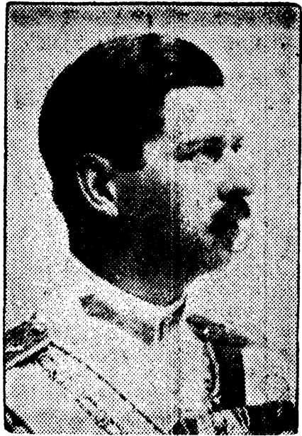
M. S. REGELE CAROL II

BRUXELLES, 10 (Radior). — Ziarele ETOILE BELGE publică, sub titlul: „Regele României și unitatea românească”, un lung articol, spunând între altele: „M. S. Regele Carol al României a reafirmat de curând intangibilitatea frontierelor românești, precum și voința sa de pace și de colaborare europeană. Suveranul a subliniat în mai multe rânduri pașnic dar nestrămutată hotărârea națională, în așa fel încât nici o îndoaială nu mai persistă asupra intențiilor legitime ale României, care dorește să mențină dreptele fronturi actuale și să le apere cu energie împotriva oricărei atingeri. Cei cari cunosc în mod efectiv istoria românilor vor înțelege și vor aproba fără rezerve dorința lor îndreptățită de a menține, și la nevoie de a apăra prin toate mijloacele, unitatea lor națională.