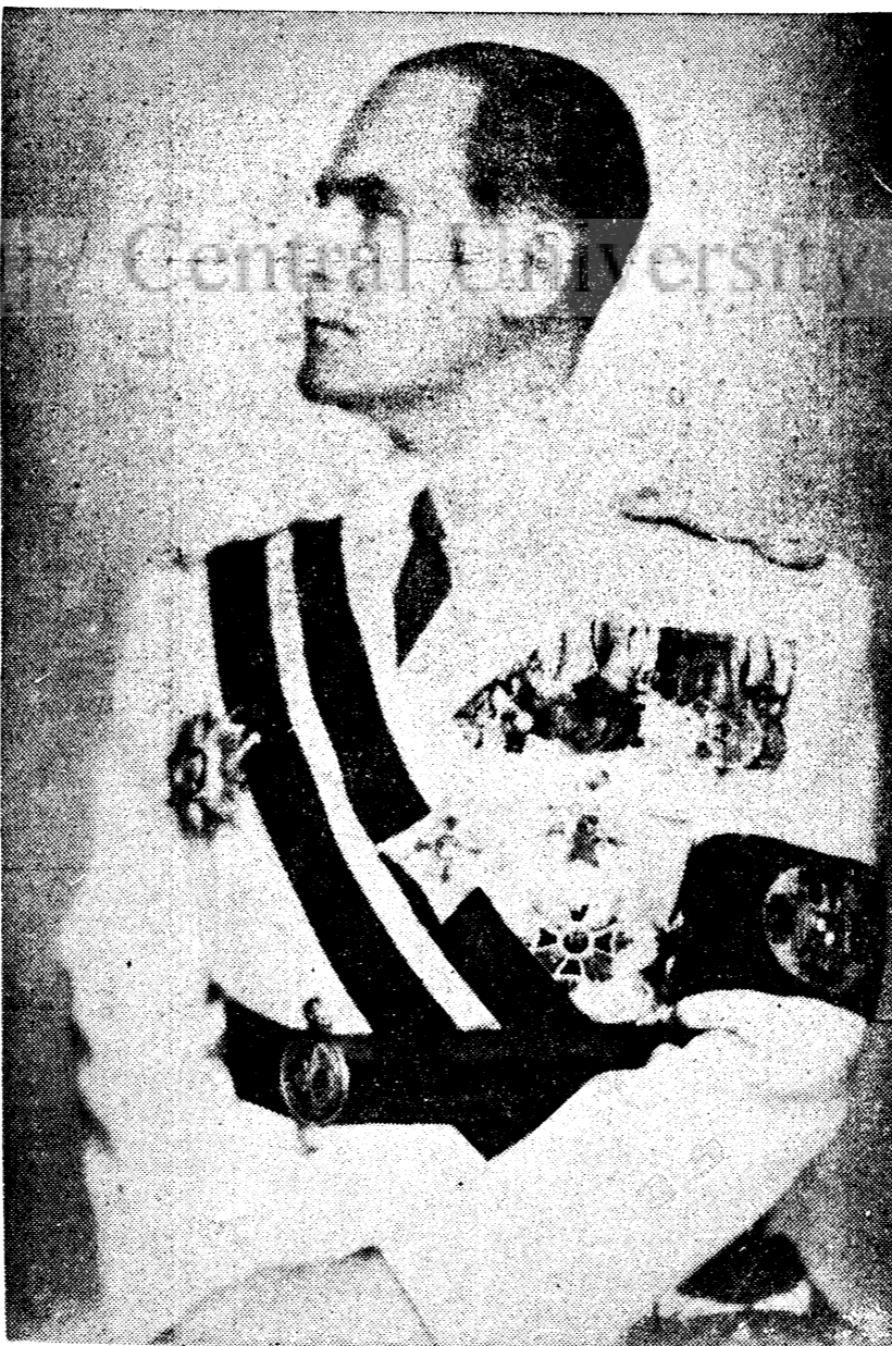
D. MITIȚA CONSTANTINESCU ministrul finanțelor și guvernator al Băncii Naționale

Printr-o concepțiune de înaltă finanță d-sa a reușit să canalizeze surplusurile de capital într-o investițiune sigură și folositoare, iar pe de altă parte a asigurat sumele necesare imediat înzestrării armatei.