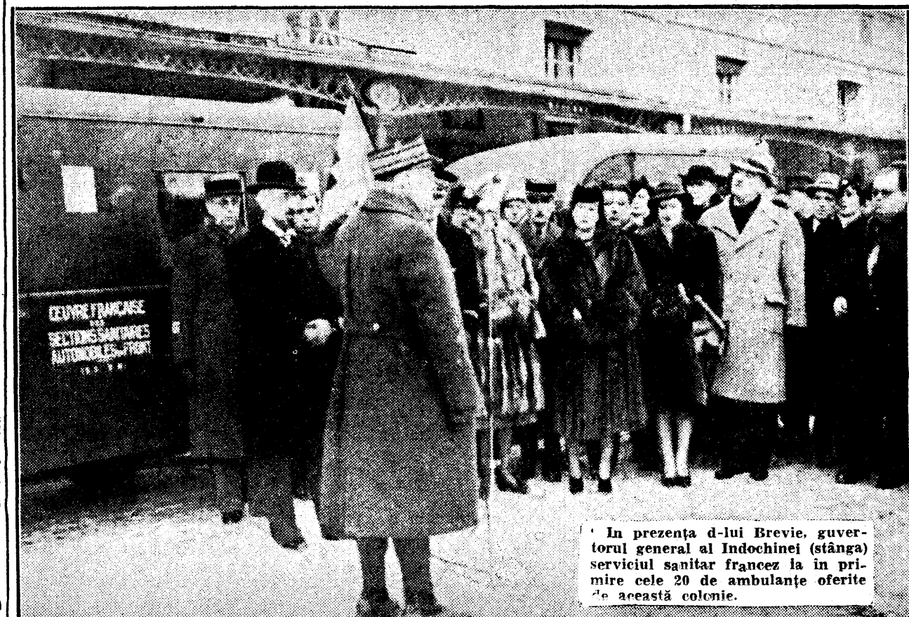
În prezența d-lui Brevie, guvernator general al Indochinei (stânga) serviciul sanitar francez la în primire cele 20 de ambulanțe oferite de această colonie.

ROMA, 10 (Radior). — Un avion de transport s'a prăbușit în apropiere de satul Aiello Calador, după ce sub sfârșământuri au fost scoase 10 cadavre carbonizate.