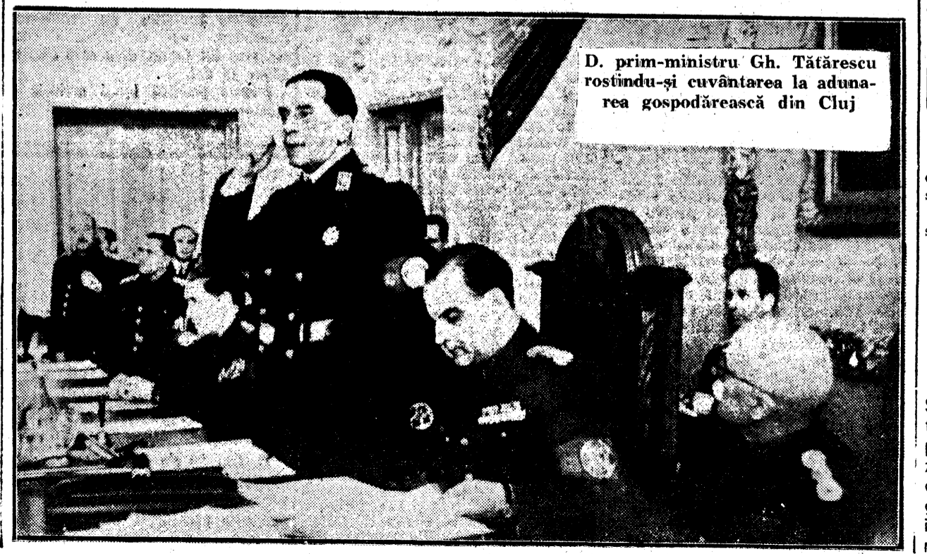
D. prim-ministru Gh. Tătărescu rostindu-și cuvântarea la adunarea gospodărească din Cluj