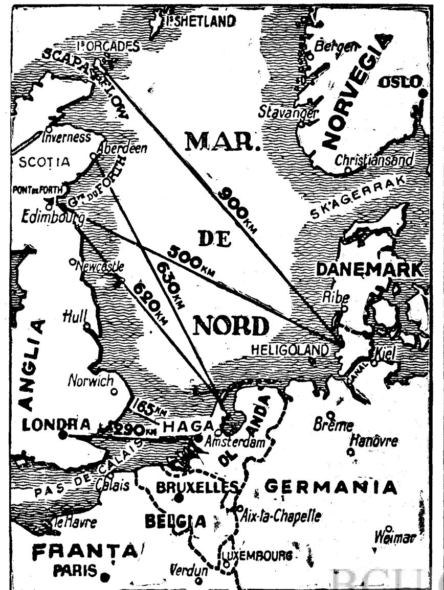
Teatrul de operațiuni aeronavale, ale frontului de Vest

Pe de altă parte, sub impresia știrilor cu privire la masiva concentrare a trupelor germane dealungul frontierei belgiene și a celei olandeze, guvernul belgian a decretat introducerea fazei D, anulând toate permisiile. Guvernul olandez, la rândul său, în legătură cu unele simptome mai puțin favorabile în situația internațională, a hotărât să nu mai acorde niciun concediu celor aflați sub arme.