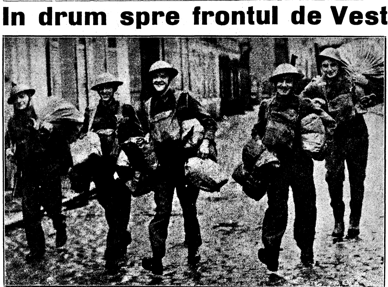
Soldajii englezi sosiți în Franța