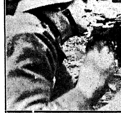
Moment de încordare pe frontul de Vest.

Sporul provine în primul rând din pricina refugiaților din Austria și Cehoslovacia.