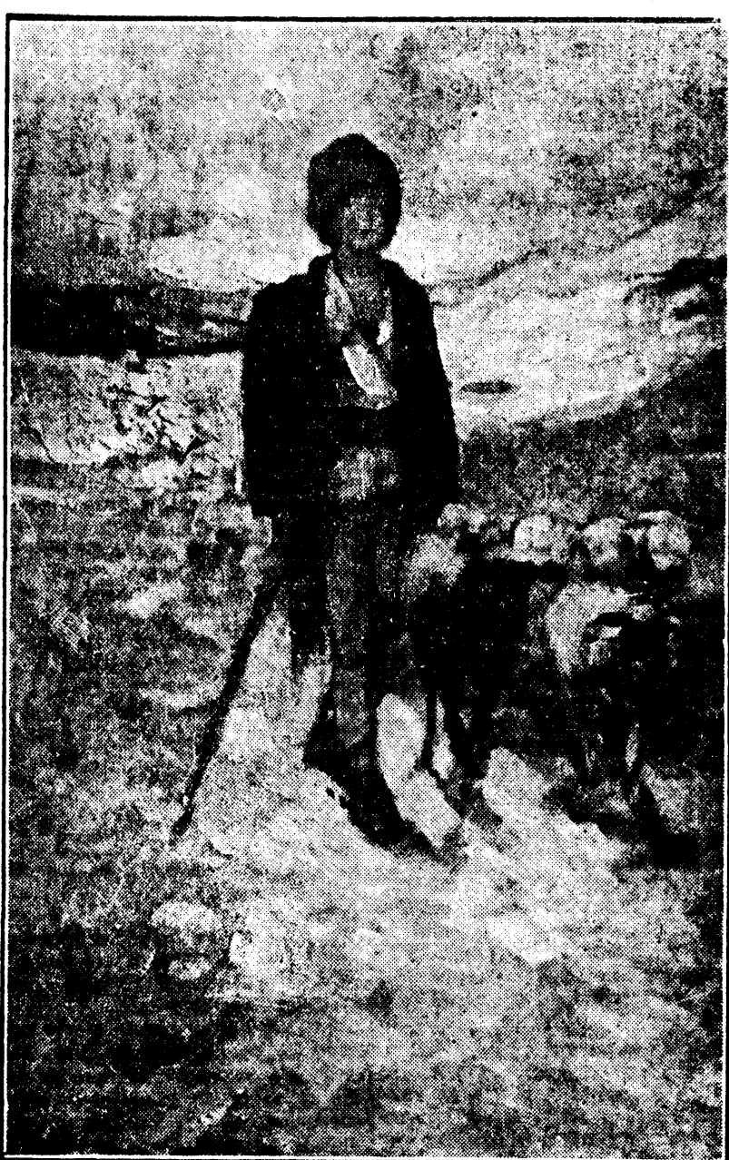
N. Grigorescu: Ciobănașul

1940 a fost hotărât „Anul turismului american” Din Washington se anunță că președintele Roosevelt a hotărât prin decret ca anul 1940 să fie „anul turismului american”