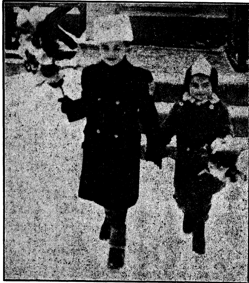
Un instantaneu de cea mai mare actualitate...