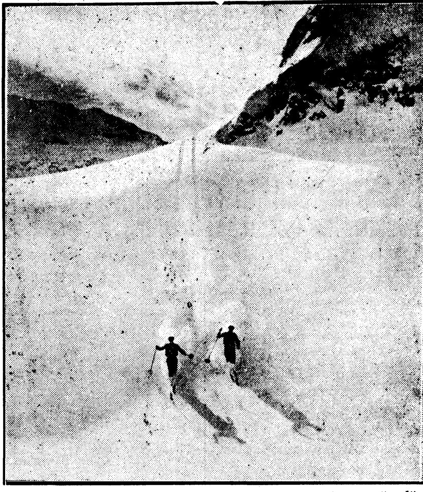
Sportivii cutreeră cu skiurile lor munții încărcăți cu zăpadă