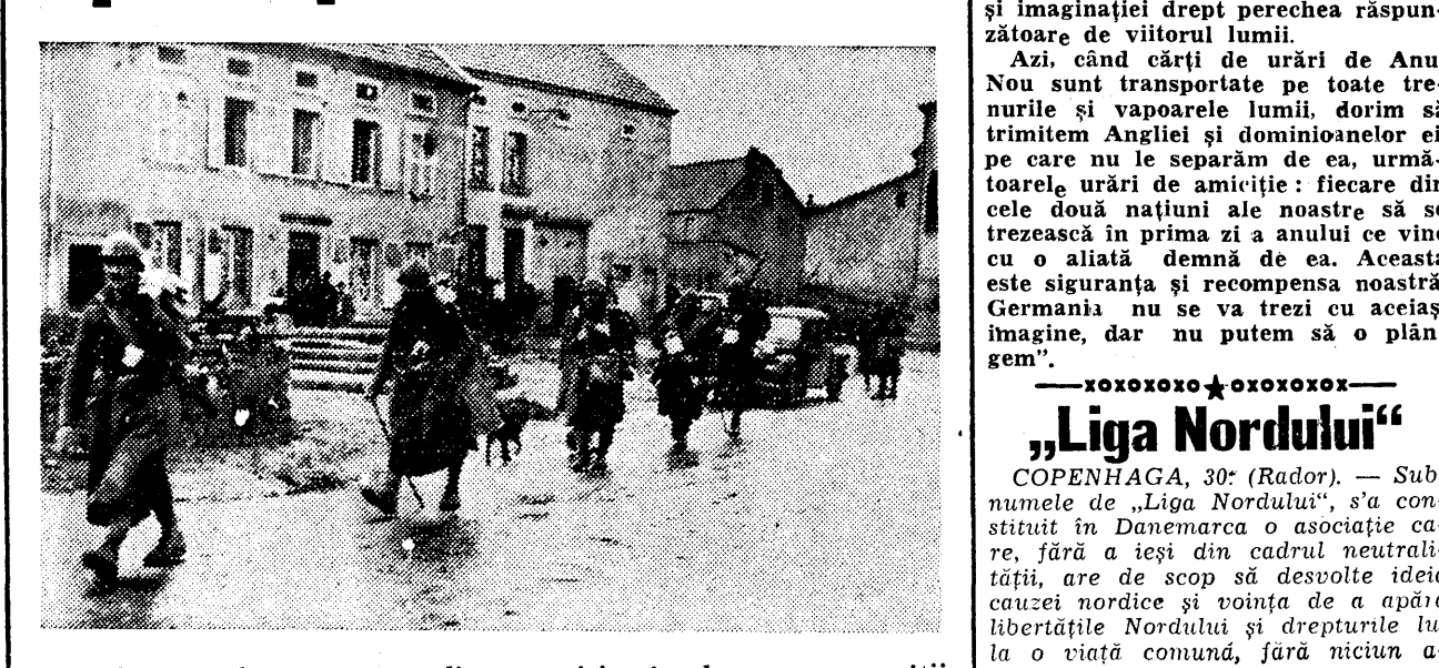
Trupe franceze la întoarcerea din permisie, în drum spre poziții