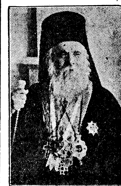
Nicodim, din mila lui Dumnezeu Arhiepiscop al Bucureștilor, Mitropolit al Ungro-Vlahiei, Patriarh al României, Ioșilor al Cezariei din Capadocia, Președinte al Sfântului Sinod. Tuturor binecredincioșilor creștini ai bisericii noastre, har și pace dela Dumnezeu, Părintele din ceruri, iar dela Noi arhierească binecuvântare.

rea și idealul măreț al Patriei. După cum toți creștinii sunt datori să se gândească și să se străduiască pentru Patria cea cerească, tot așa suntem datori toți românii laolaltă să întărim și să ne jertfim chiar, pentru Patria noastră cea pământească, pentru scumpa noastră Tară. Patria trebuie să devină azi, simbolul rezumativ al tuturor preocupărilor și al tuturor eforturilor. Neamul nostru românesc ca unitate spirituală și Tară privită ca unitate geografică, se împletește ca într-un buchet și se contopesc împreună minunat, în Patrie. Pentru ca România să ajungă așa cum este azi, o țară mare și puternică, câtă jertfă, câtă încordare și cât sânge n'a cerut din partea atâtor șturi de generații. Mii și milioane de brațe s'au ridicat ca un zid de oțel pentru apărarea ei și mii și milioane de piepturi dărze au bătut puternic pentru fericirea ei. Nu trebuie uitat trecutul, căci atunci se desiră lanțul sufletesc al țării naționale. Patria este tot ceace este mai scump și mai măreț în aceste clipe de acum. Căci ea este vatra sfântă în care arde fără încetare focul vieții românești. Nădejdea de mâine se sprijină pe disciplina și acțiunea unui patriotism luminat, de azi și de ieri. Să nu fie deci români, care să nu aibă ca un soare nestins acest ideal, al dragostei ne-țarmurite pentru Tară, Altar și Rege și să nu fie cetățean al acestei îngăduitoare și bune Țări, care să nu-și însușească datoria sinceră de a servi Patria.