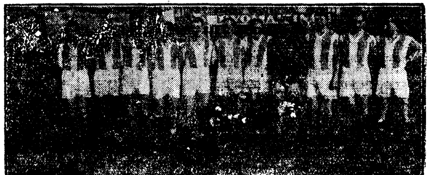
Cei 11 jucători ai Hungariei

gea ajunge la Barbu care, printr'un shoot puternic marchează imparabil, în colțul opus al porții, mărind avantajul cu 2-0.