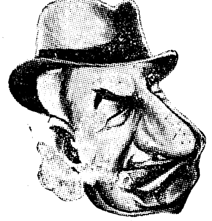
D. C. ARGETOIANU

PRIETENII POLITICE ȘI DOCTRINE DAUNATOARE Intr'un regim de desmăc economic, nu se pot călăi suflute pentru a face față grelelor încercări, pe cari ni le poate aduce ziua de mâine. Mizeria este un rău stătuitor și omul necăjit pleacă ușor urechea la șoaptele agitatorilor și dușmanilor săi. Când omul își spune: mai rău decât așa, nu se poate, — înseamnă că nu mai găsește în sufletul și mintea lui, răsvătrările de rezistență împotriva curentelor periculoase. Avem un vecin puternic peste Nistru, cu care dorim să trăim în pace. Nu putem însă să nu despărțim ideologia comunistă de relațiile noastre cu republica vecină. Noi nu ne amestecăm, căsuși de puțin, în regimul politic de dincolo de Nistru și cerem ca nici cei de dincolo de Nistru să nu se amestece în organizațiunea noastră socială. O ofensivă comunistă în aproape toate țările Europei nu mai poate fi contestată astăzi. Ea nu se mai face pe față, ci pe căi piezoase, comunistul arătându-se sub foma unei politici antisocialiste și sub hainele așa ziselor „Fronturi populare” și „Acțiuni cetățenești”. Sub masca Frontului popular și acțiunilor anti fascistice, comunistul a cucerit deja Spania, amenință să cucerească Franța, se amestece în treburile Greciei și în ale noastre. Ademenirea partidului național-țărănesc, care a încheiat cartelul cu elemente de extrem stângă, sub forma unui „Front popular”, în ulți-