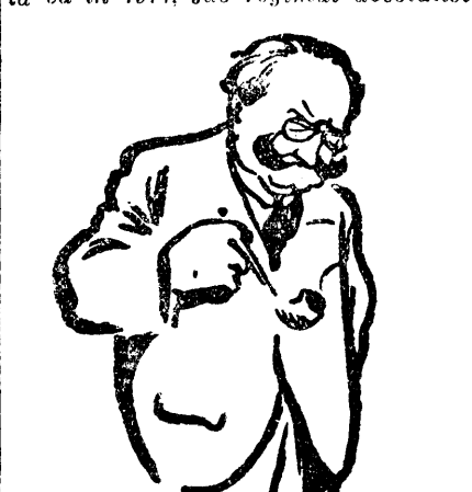
Arist era 170.000 condamnați și deținuți politici, pe când astăzi sunt în Rusia Sovietică — după înseși declarații

cele nu cunoaște realitățile, cari arată că în 1911, sub regimul absolutist