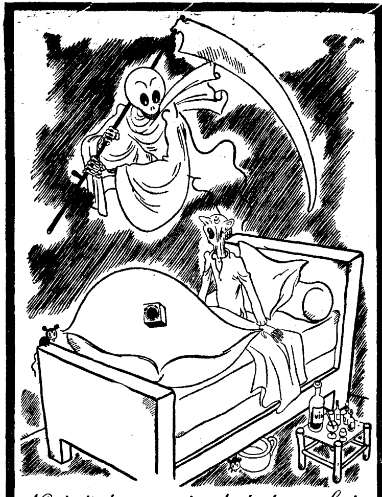
Nici asta nu ie dat dracului - la pus pe vede Șta Paraschiva la cale să ia o Testa contra gripei, - greu de trăit, somay pretutindeni!!