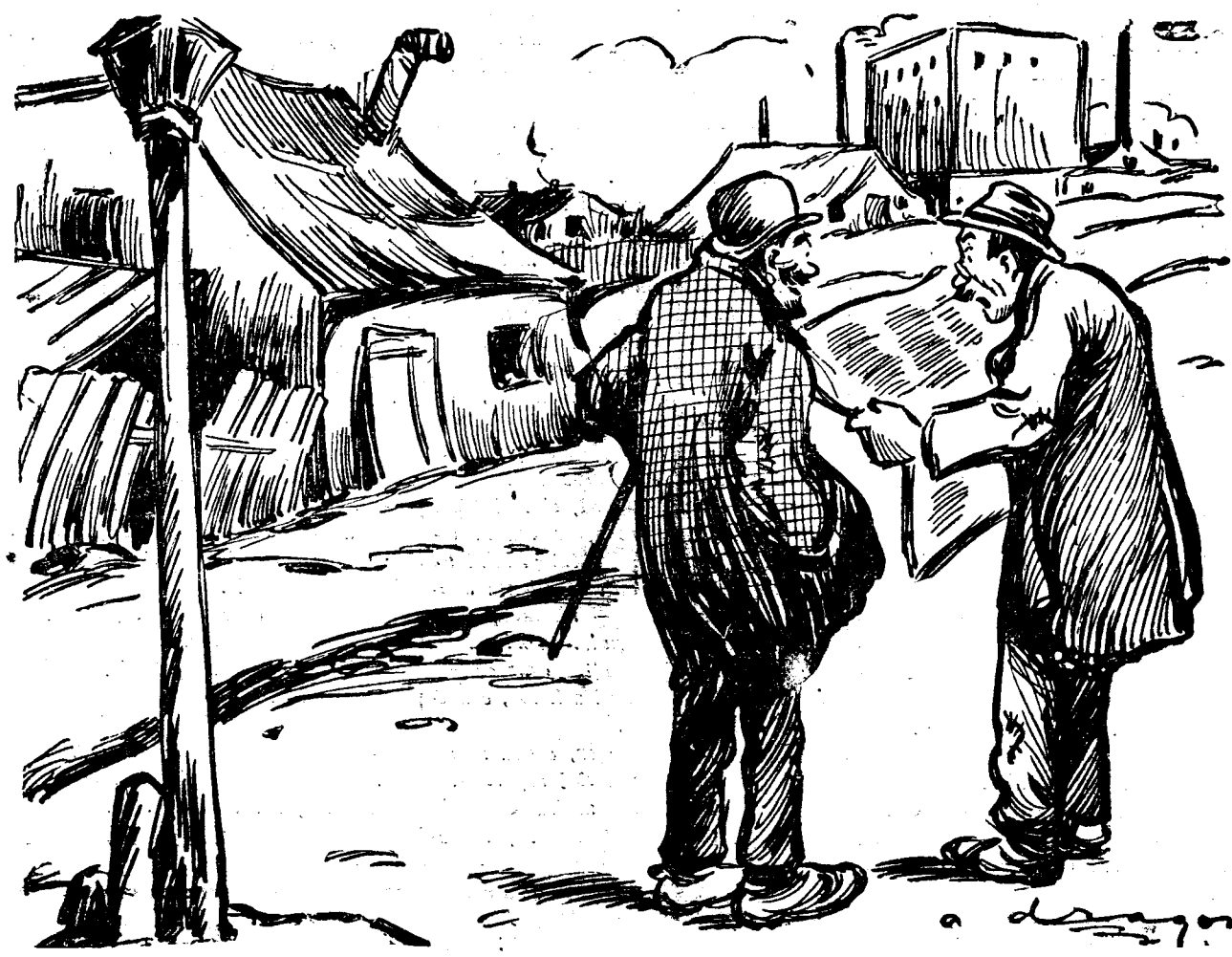
— Tu intri în conversiune? — Eri intram. Azi văd că am rămas pe dinafară. — Să așteptăm și modificările de mâine...