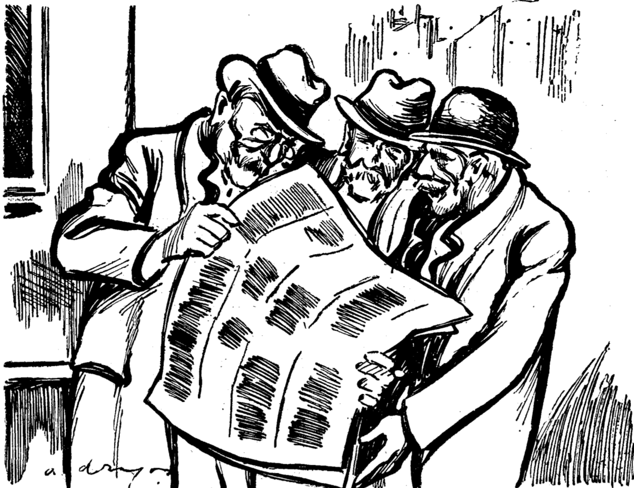
Auzi, nene, că deacum înainte Camera o să țină ședință cu oricâți deputați prezenți... Ce-ar fi, domnule, dacă ar ține ședință și fără deputați? Poate că s'ar lucra mai repede și s'ar face și economie la diurne...

Nimeni nu poate contesta faptul că scandalurile financiare din Franța sunt în funcție de carenta regimului democratic-parlamentar. Abuzul de putere și traficul de influență sunt cele două atribute fundamentale pe care se bazează existența acestei faune de stipendiați ai corupției.