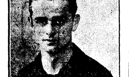
HADA Portarul țeamului pestan

Compatrioții noștri s'au întrebuintat la maxim pentru a realiza dr-