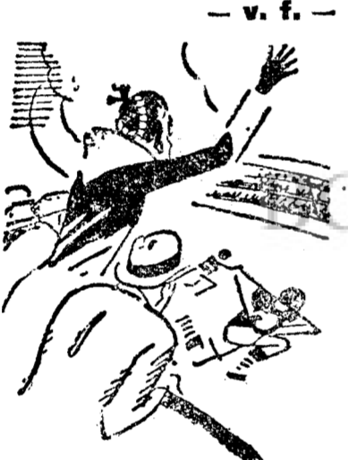
GRETA GARBO Romană de CEZAR PETRESCU

E drept că de atunci, deși francezii s'au progresat, au suferit însă un mare declin de formă.