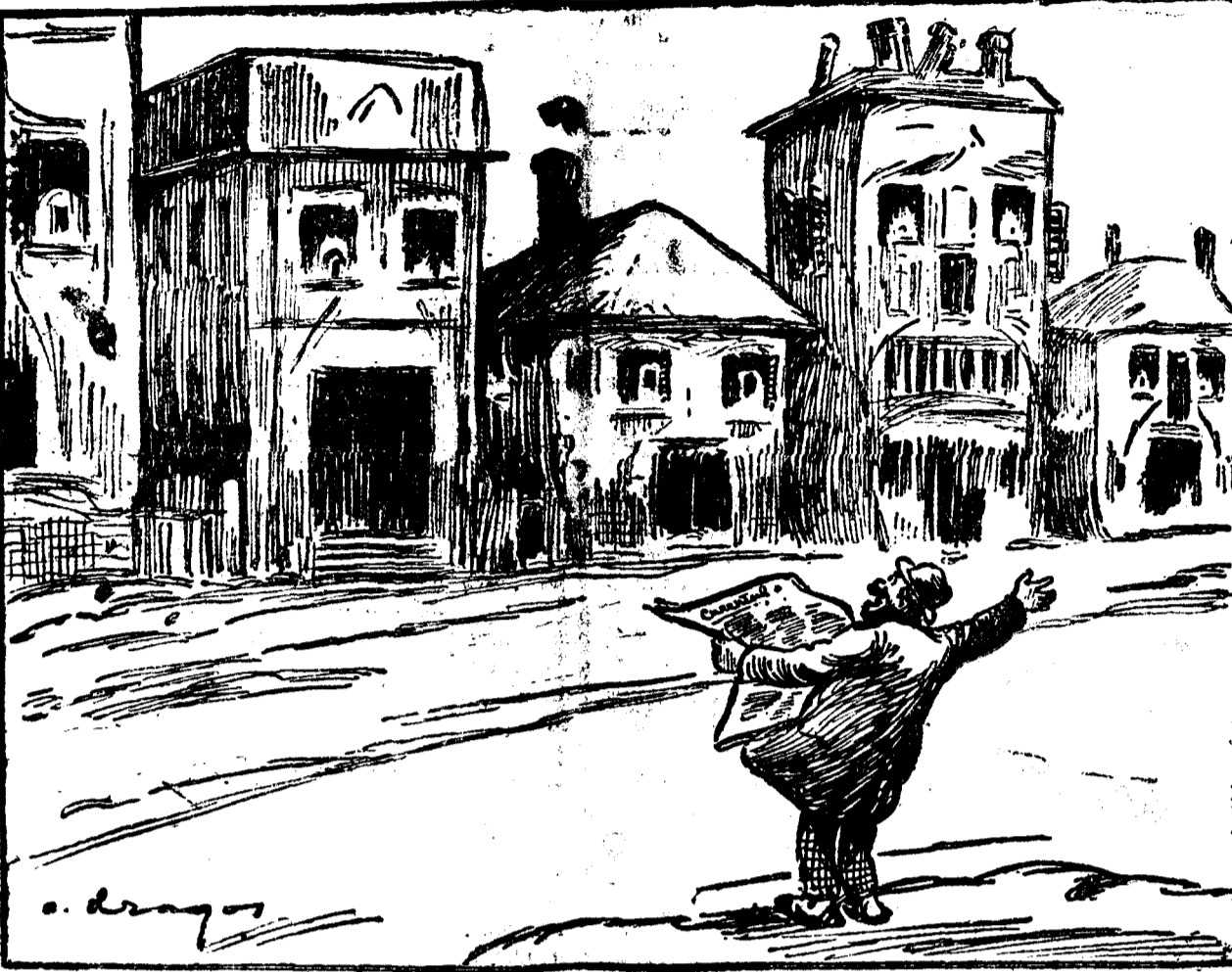
CETATEANUL (căt re casele bucureștene) i Vați ras! Ia a venit Dobrescu la Primărie...