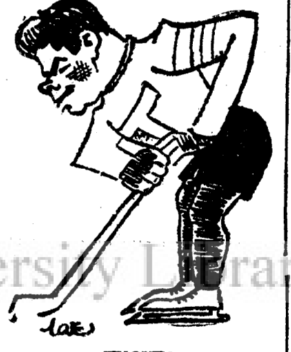
TUCKER (Telephon Clubului Român)