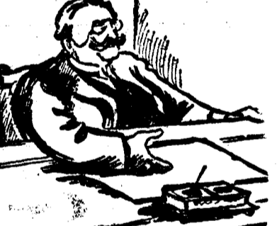
D. VAIDA VOIEVOD

CLUJ, 17. — Situația în sânul partidului național-tărănesc se arată din ce în ce mai încordată și prevestește, pentru după alegeri o completă clarificare, ce va avea de stabilit de partea cui stă poporul ardelen. Conciliabilele ce au avut loc în ultimele zile, ne pot da intrucăiva o părere asupra celor ce au să se întâmple.