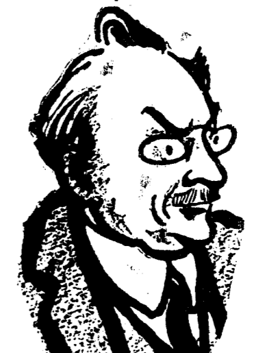
D. I. G. DUCA

Ideea de progres democratic. Știu că iubitorii de inovații și întăritorii de profesione propovăduiesc formulele noul de guvernământ la adăpostul cărora să-și poată reface situațiunile pierdute sau să poată realiza ambiții pe care desfășurarea normală a evenimentelor nu le-ar îngădui-o. Dar noi rămânem credincioși vetei constituționale și numai în cadrul ei vedem puntea unei dezvoltări și a unui progres statornic în opera de consolidare a României întregite, operă care constituie menirea însăși a generațiunii noastre.